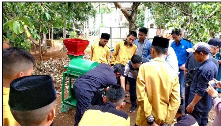
Gambar 5. Proses Penghancuran Sampah Kering

Sampah kering atau yang telah dikeringkan tersebut, kemudian dikumpulkan ke dalam wadah untuk kemudian dihancurkan oleh mesin pencacah. Proses pencacahan dimaksudkan agar proses pembusukan berlangsung cepat (Sudarman, 2014). Pada Gambar 5 menunjukkan proses penghancuran sampah kering agar dapat mempercepat proses pembusukan.