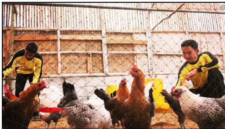
Gambar 2. Kegiatan Peternakan di Pondok Pesantren Al Umanaa

Diperkirakan jumlah siswa, guru dan staff dalam pesantren Al Umanaa kurang lebih sebesar 200 Jiwa. Dengan jumlah tersebut, tentunya diperlukan menejemen sanitasi yang baik hususnya menejemen limbah. Hal ini dikarenakan limbah yang dihasilkan tiap satu jiwa sebesar 2,2 Kg/hari bila kita kalikan dengan jumlah jiwa di dalam pesantren maka limbah yang dihasilkan akan mencapai 440 Kg/hari. Tentunya hal ini perlu ditangani secara serius, sedangkan hingga saat ini penanganan limbah yang diketahui hanya ditumpuk kemudian diangkut ke Tempat Pembuangan Akhir (TPA). Padahal limbah tersebut masih memiliki potensi besar untuk didaur ulang baik menjadi