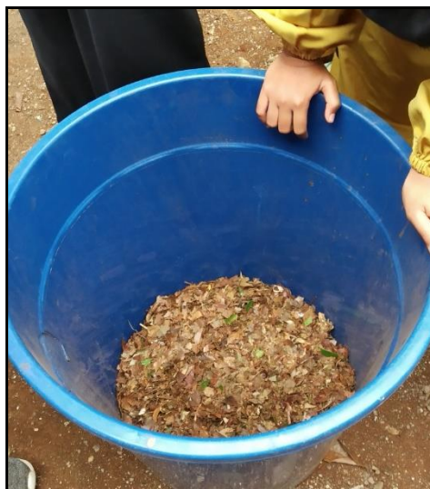
Gambar 6. Hasil Penghancuran Sampah Kering