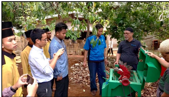
Gambar 8. Penyuluhan Perawatan Alat

Pada Gambar 8 tampak selain kegiatan proses pengolahan sampah, tim juga melakukan penyuluhan proses perawatan alat. Baik dari proses melihat kondisi mesin, bahan bakar diesel, oli, sampai ke mata pisau. Tim pengabdian dari PNJ juga bersedia untuk memberikan pelayanan dalam hal pengasahan mata pisau yang sudah tumpul di kemudian hari dan konsultasi berbagai hal terkait perawatan mesin tersebut.