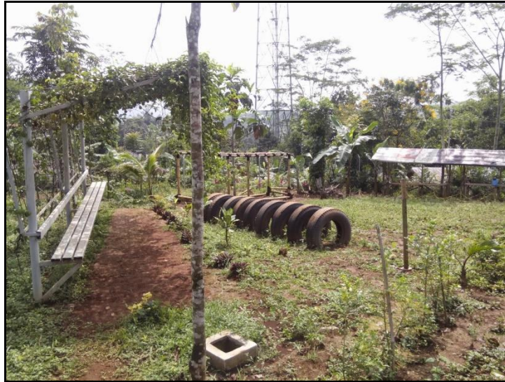
Gambar 1. Lahan Tanaman Buah Merambat di Pondok Pesantren Al Umanaa

Pesantren Modern Al Umanaa merupakan salah satu lembaga pendidikan berasrama tingkat SMP dan SMA yang terletak di desa Kebonmanggu, kecamatan Gunung Guruh, kab. Sukabumi. Pesantren Al Umanaa berbasis kepada akhlaq dan berorientasi kepada lingkungan. Dalam mewujudkan orientasi lingkungan, pesantren Al Umanaa menanamkan kemampuan dasar dalam pertanian dan peternakan serta penelitian dasar kepada para siswa. Hal tersebut didukung dengan disediakannya peternakan dan lahan pertanian seluas 6 hektar di lingkungan pesantren (Anonim, 2018).