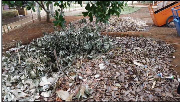
Gambar 4. Sampah Kering Sebagai Bahan Sumber

Sampah kering atau yang telah dikeringkan tersebut, kemudian dikumpulkan ke dalam wadah untuk kemudian dihancurkan oleh mesin pencacah. Proses pencacahan dimaksudkan agar proses pembusukan berlangsung cepat (Sudarman, 2014). Pada Gambar 5 menunjukkan proses penghancuran sampah kering agar dapat mempercepat proses pembusukan.