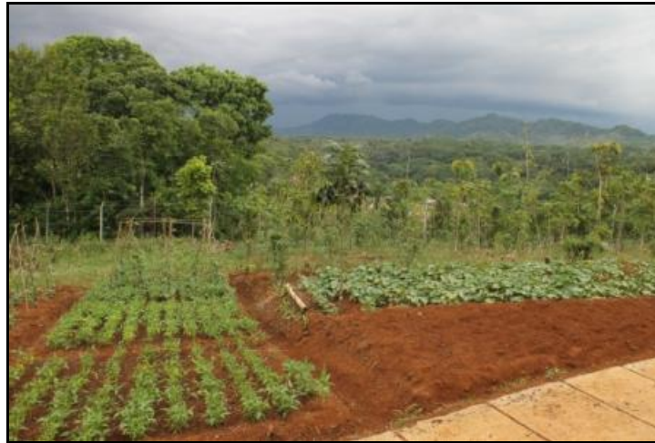
Gambar 7. Lahan Pertanian yang Digunakan untuk Pemupukan

Hasil dari proses penghancuran sampah yang ditunjukkan pada Gambar 6, selanjutnya dikumpulkan dan dicampurkan dengan tanah atau pupuk organik yang sudah jadi sebagai peningkatan volume jumlah pupuk. Kemudian dapat dicampurkan dengan tanah di wilayah pertanian dan perkebunan yang ditunjukkan pada Gambar 7 berikut.