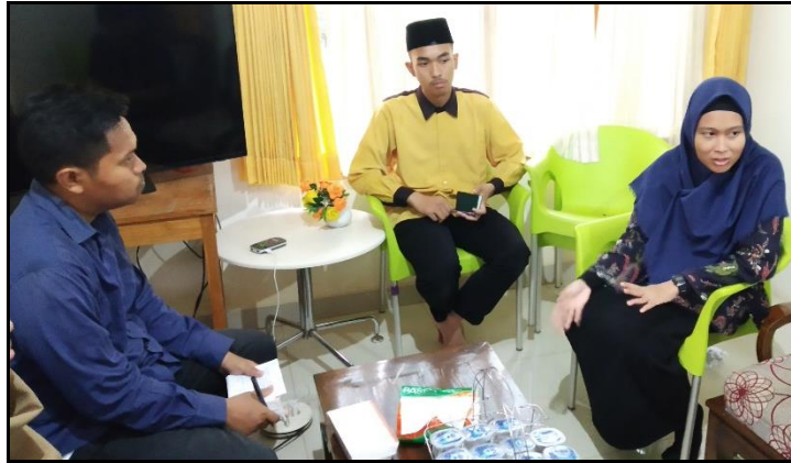
Gambar 9. Wawancara untuk Feedback Kegiatan Pengabdian kepada Masyarakat yang dilaksanakan PNJ di Al Umanaa Sukabumi.