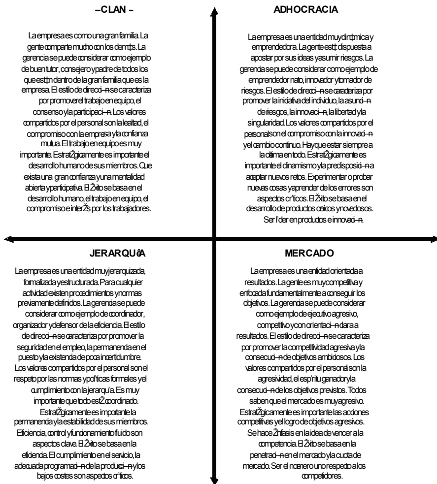
Figura 2 Definición de los tipos de cultura según Cameron y Quinn (1999)

Aquí podemos observar que los valores, normas y costumbres anteriormente expresados como propios de una cultura innovadora, coinciden con los relativos a la cultura de adhocracia, especialmente si ésta sabe combinarse con valores, normas y costumbres característicos de la cultura clan. Concretamente, se trata de la existencia real de unos valores, normas y costumbres centrados en el deseo de mejora continua del entorno de trabajo y de la organización.