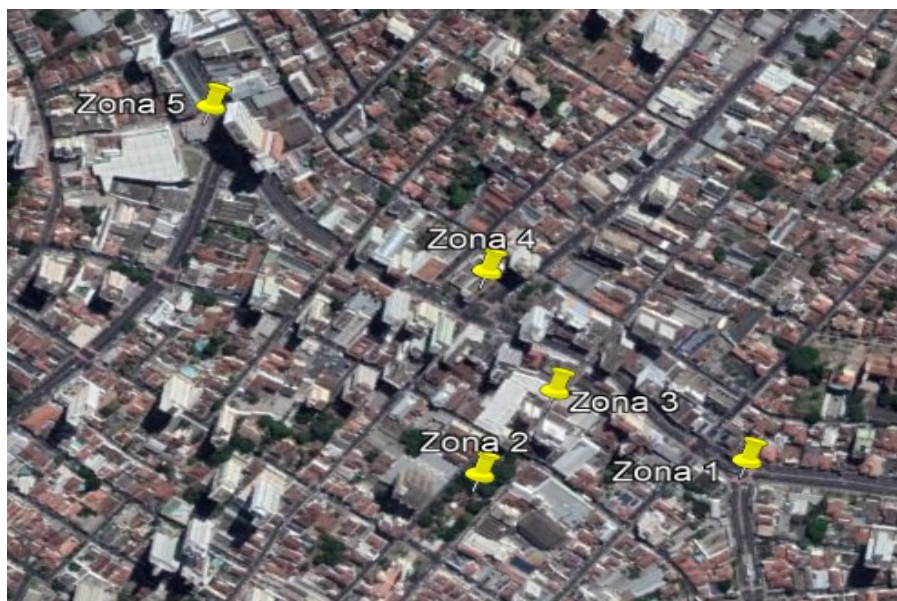
Figura 1 – Zonas de estudos na região central de Uberaba – MG