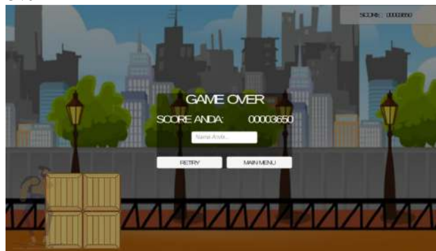
Gambar 4 Halaman Game Over