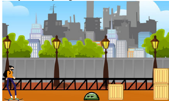
Gambar 3 Halaman Game Play

Halaman gameplay adalah tampilan halaman ketika pemain sedang memainkan aplikasi game . Berikut tampilan dapat dilihat pada gambar 3.