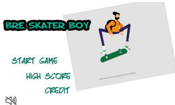
Gambar 2 Halaman Menu Utama

Pemain dapat memilih pilihan antara lain seperti : start game (untuk memulai permainan), credit (menampilkan seputar info tentang penulis atau perancang aplikasi game ), high score (untuk menampilkan score paling tertinggi sampai score paling terendah).