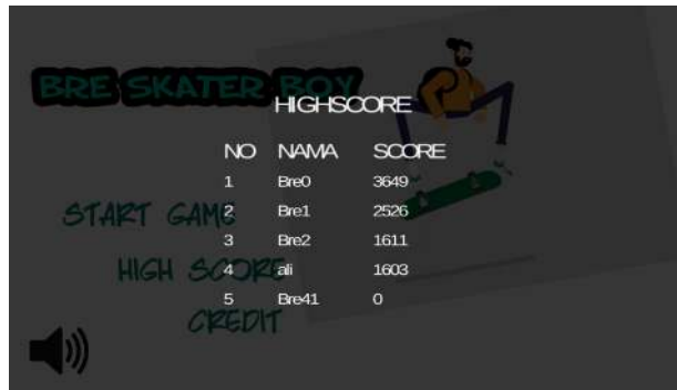
Gambar 5 Halaman High Score

Halaman high score adalah halaman yang berisi tentang score paling tertinggi sampai score paling terendah. Player memperoleh score setelah memainkan satu permainan sampai game over . Jumlah score dihitung dari jauhnya jarak yang telah dilalui oleh player tersebut, serta lamanya waktu permainan yang dimainkan.