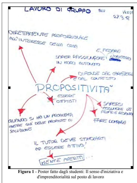
Figura 1 - Poster fatto dagli studenti: Il senso d'iniziativa e d'imprenditorialità sul posto di lavoro

Un terzo tipo di learning outcomes riguarda i poster prodotti dai ragazzi e studiati come concetti mentali condivisi, in linea con la teoria dell'apprendimento espansivo (Engeström, Pasanen, Toiviainen, & Haavisto, 2005) che vede il processo di apprendimento all'interno del laboratorio come una sequenza di fasi. In questo contesto i cartelloni sarebbero prodotti dell'elaborazione di gruppo, dunque concetti condivisi, che guidano poi le azioni individuali dei partecipanti – soprattutto gli studenti sul posto di lavoro. Alla fine di ciascun laboratorio ai ragazzi veniva dato il compito di riassumere i concetti più interessanti dando un nome al cartellone: un poster riguarda 'la propositività' sul posto di lavoro, mentre altri due lo 'stage ideale'.