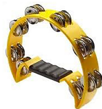
Gambar 5. Bentuk Alat Musik Tamborin Sebagai Salah Satu Elemen Pembentuk Adegan Bondres Dalam Wayang tantri