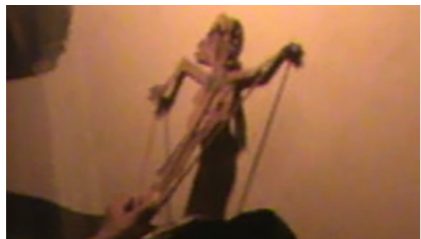
Gambar 3. Tokoh Bondres Wayang Nenek Lincah