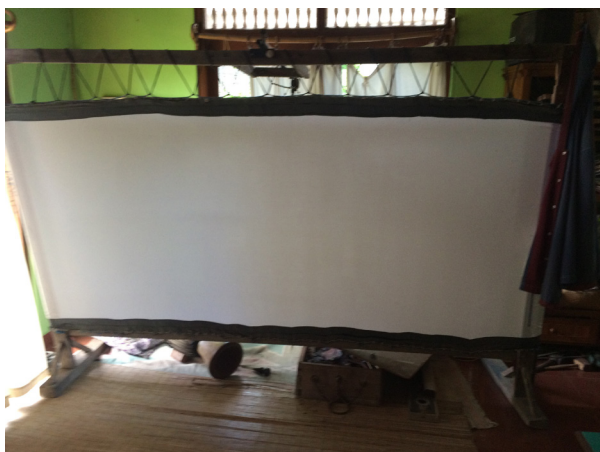
Gambar 11. Tampak Depan tempat latihan dan mengekspesikan diri oleh Dalang Wija