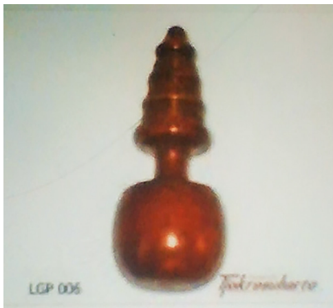
Gambar 6. Bentuk Cepala (alat pemukul kotak (keropak) wayang)