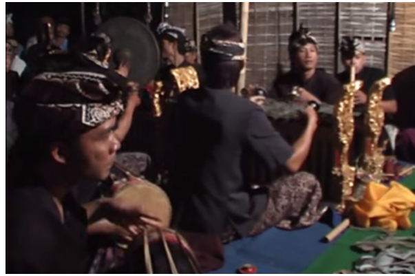
Gambar 7. Struktur Setting Elemen Pendukung Adegan Bondres Wayang Tantri

Modernisasi sebagai motor pembaharuan di Bali, secara implisit akan membawa pengaruh budaya Barat, masuk ke dalam repertoar kesenian Bali khususnya seni pewayangan, karena seni pewayangan ini sifatnya sangat kreatif dan adaptif (Seramasara, 2005, hlm. 06). Hal tersebut terefleksi melalui masuknya teknologi yang memengaruhi bentuk wayang dan kreativitas Dalang Wija di mana berikutnya berimbas pada penambahan elemen-elemen pendukung pentasnya selain dari pada penggunaan alat musik tradisi yang telah terpadu menjadi pengiring tetap pementasan Wayang Tantri. Penambahan jimbe dan tamborin yang merupakan alat musik modern merupakan salah satu bentuk modifikasi tambahan dalam adegan bondres oleh I Wayan Wija. Sebagaimana struktur dalam peletakan berbagai elemen-elemen pendukung adegan tersebut dapat dilihat pada gambar 7.