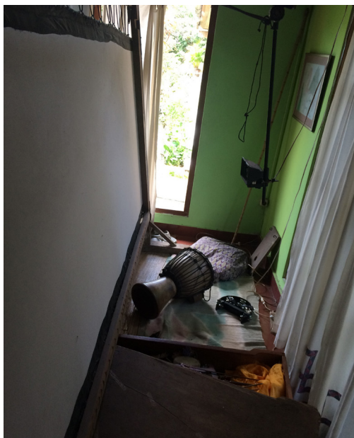
Gambar 10. kelir lengkap dengan pencahayaan, jimbe beserta tamborin