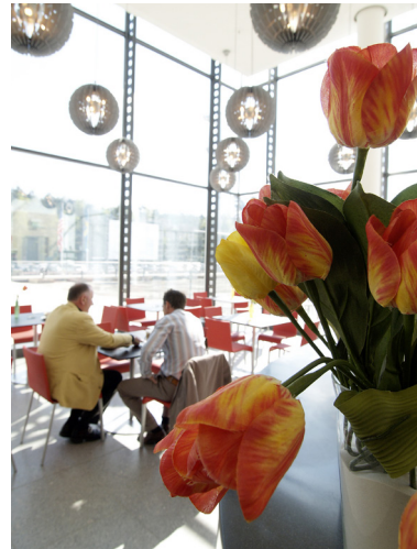
Abb.: Nürnberg Convention Center Ost (Bistro, Ebene 0).

Klaus-Rainer Brintzinger (Vorsitzender des Vereins Deutscher Bibliothekare)