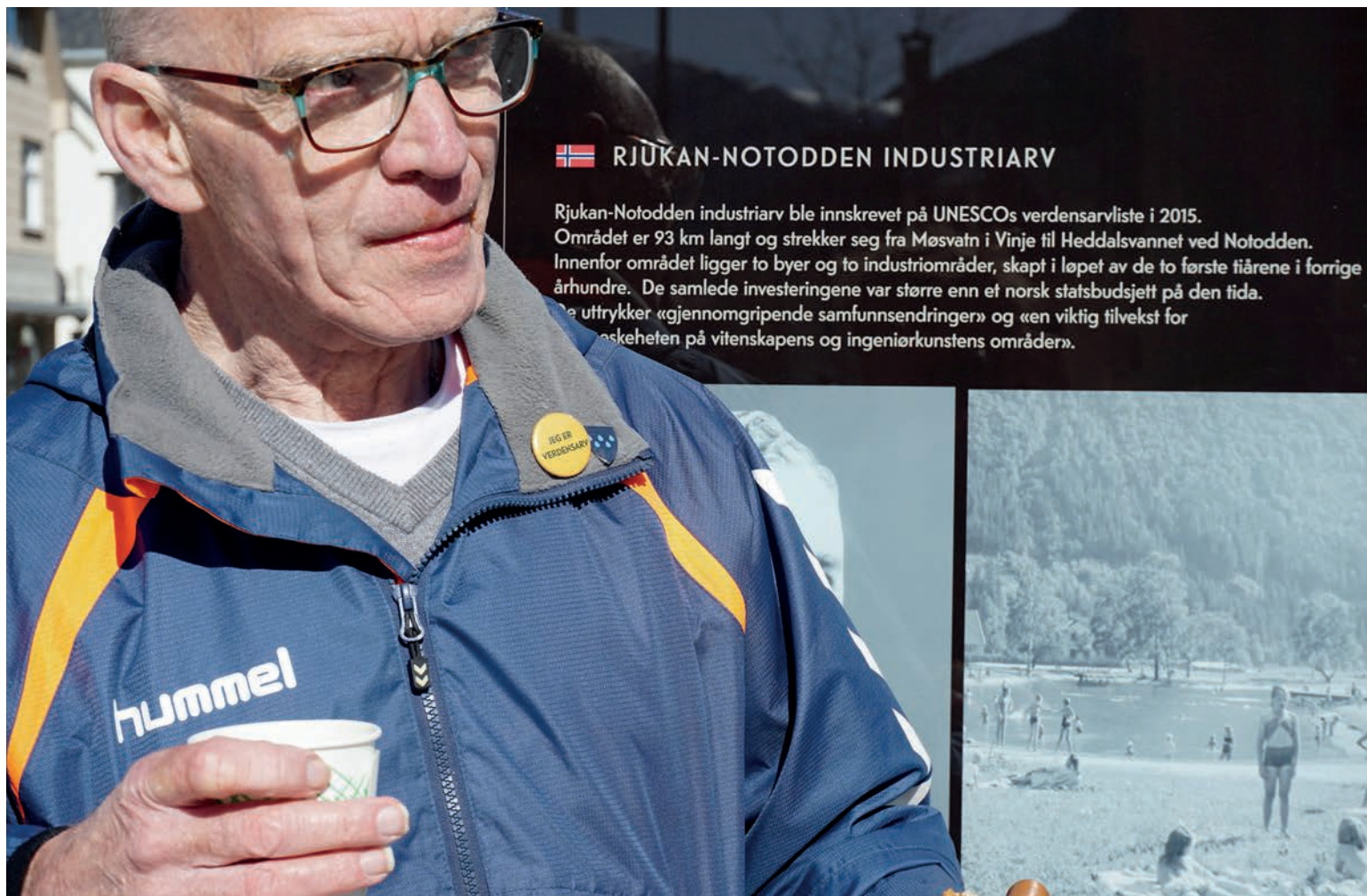
Jeg er verdensarv.

kongelige ekteparet, til jubel, flagg, blitz og barnesang på Mæl stasjon, ble geleidet om bord i M/F Storegut – en nesten 90 meter lang jernbaneferje som fra 1965 traverserte Tinnsjøen med opptil 3000 tonn gods i døgnet for industriselskapet Norsk Hydro (Løndal 2010).