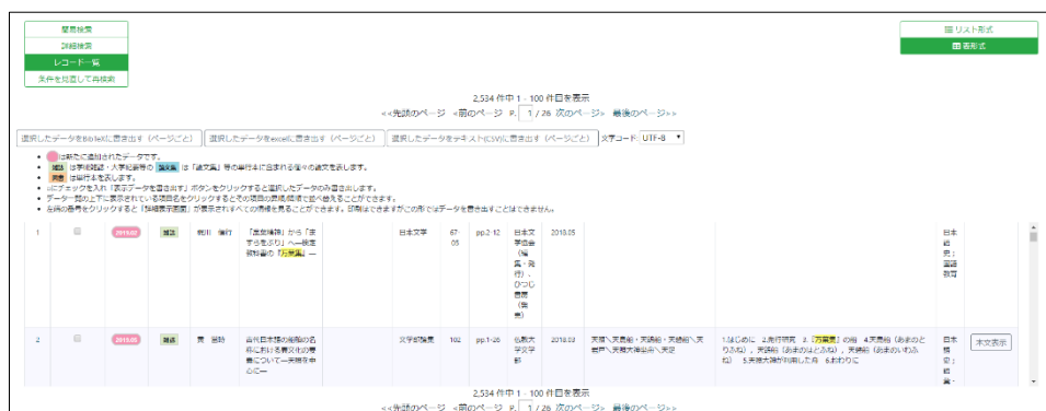
〈日本語研究・日本語教育文献データベース:表形式での表示〉

このように、表形式は一覧性が高いものの、モニタの画面サイズがあまり大きくない場合に、項目が折り返されてしまうため、かえって見にくくなることがあることが