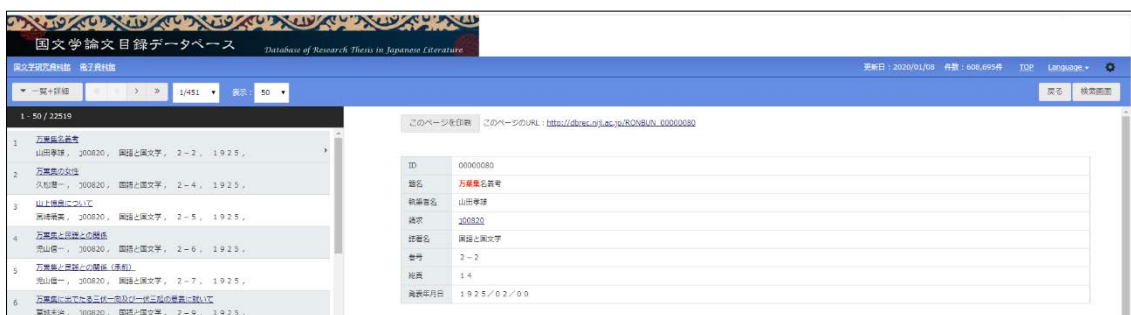
〈図 1-1〉: 検索結果一覧+詳細画面