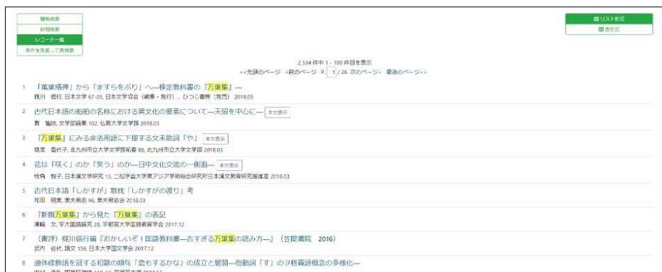
〈日本語研究・日本語教育文献データベース:リスト形式での表示〉

データベースの機能として、表形式とリスト形式をもつ日本語研究・日本語教育文献データベースを例にとると、表形式での表示は、項目が多くても視認性が高くなり、多くの情報を一度に見ることが出来る。それに比べてリスト形式では視認性を高くしようとすると項目数をしぼる必要があり、逆に項目数を増やそうとすると行数が増えるため視認性が低くなる。