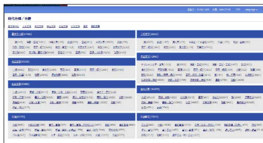
(検索画面:時代分類/分野)

国文学研究資料館 OPAC (Online Public Access Catalog)と連携しており、請求記号をクリックすることで同館のOPACにアクセスが可能。