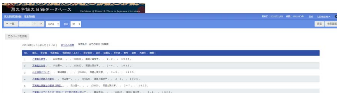
〈図 1-1〉: 検索結果一覧画面