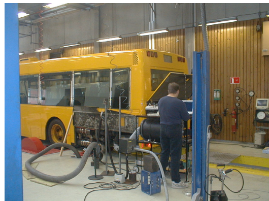
Test ved Teknologisk, Århus 12 juni 2003

Det der gør kombinationen mellem et katalytisk partikelfilter og et SCR system, som omtalt ovenfor, yderligere attraktiv er, at qua, det høje reduktions potentiale i SCR teknologien, gives der mulighed for at dieselmotoren kan justeres til at arbejde mere "magert".