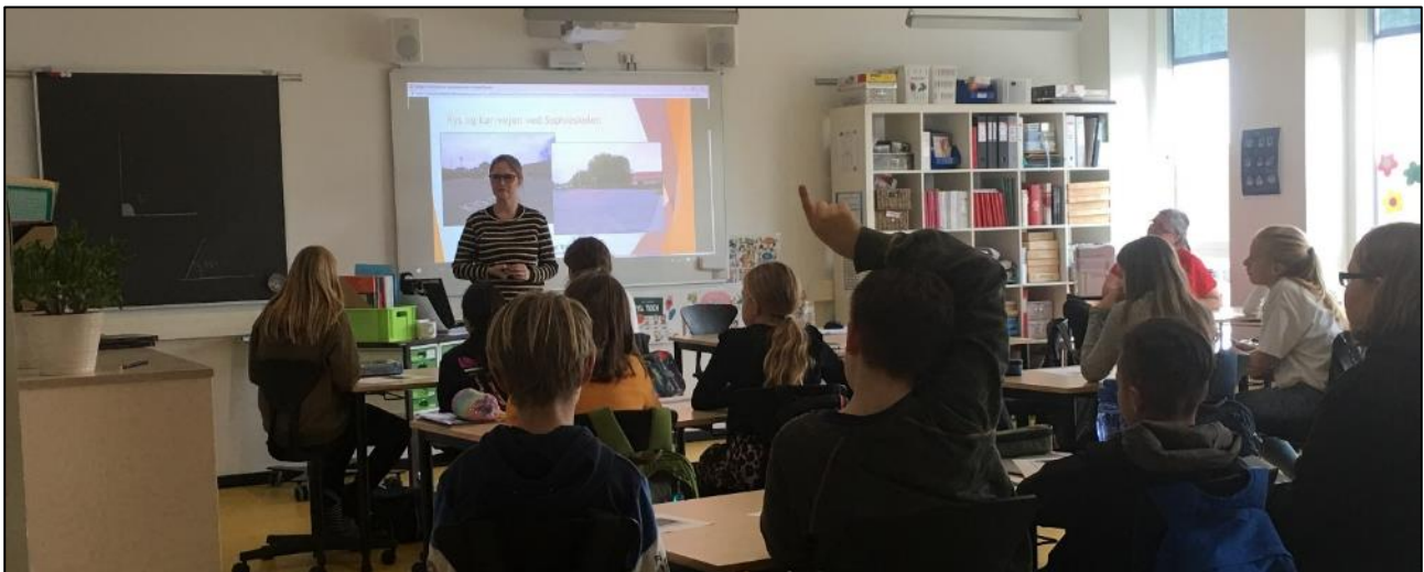
Figur 1: Igangsætning af trafikopgaven i 5. klasse

Et hold på 21 elever fra 5. klasse på Sophieskolen har brugt ca. 4 timer på at lave denne opgave. Eleverne har arbejdet i grupper på 2-4 elever. Opgaven bestod af seks spørgsmål omhandlende transportvaner til og fra skole samt deres oplevelser ved færden i kys og kø anlægget ude foran skolens hovedindgang. Derudover blev eleverne bedt om at komme med forslag til, hvordan anlægget ville kunne forbedres. Til sidst skulle eleverne tage billeder og lave beskrivelser af udvalgte situationer i Kys og Kør anlægget.