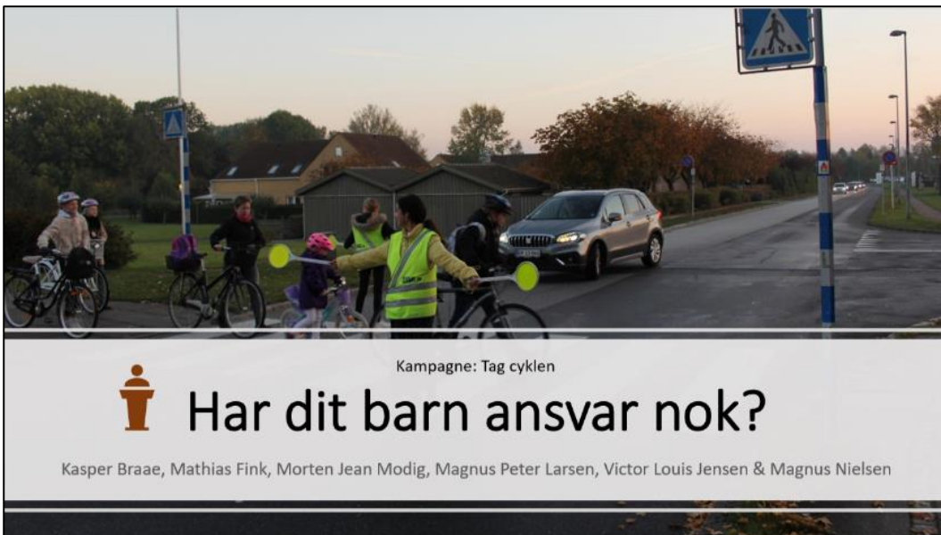
Figur 4: Eksempel på kampagneplakat