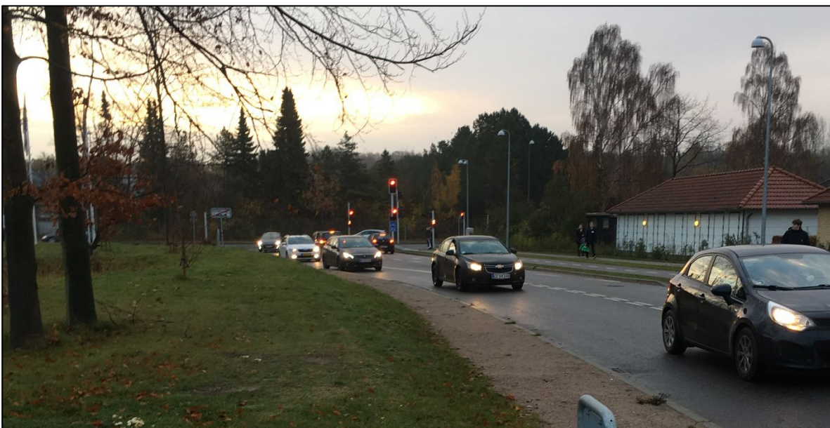
Figur 5: Krydset Skovalléen-Merkurs Plads en morgen ved 8-tiden.

Et hold på 20 studerende fra holdet Innovation på HTX/HHX på CELF har brugt ca. 10 timer på at løse denne opgave. Innovationsfaget handler om at udvikle nye løsninger for en teknisk problemstilling. Opgaven bestod i at besigtige og kortlægge trafikale problemer i signalkrydset Skovalléen-Merkurs Plads, som er den primære adgangsvej til Campus. Derefter skulle de studerende udarbejde to alternative løsningsforslag til afhjælpning af de problemer, som de havde fundet i krydset.