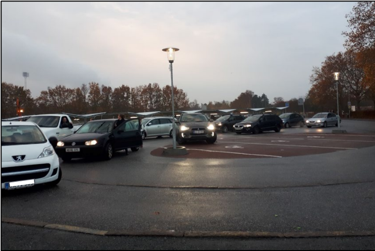
Figur 2: Skolens kys og kør anlæg om morgenen