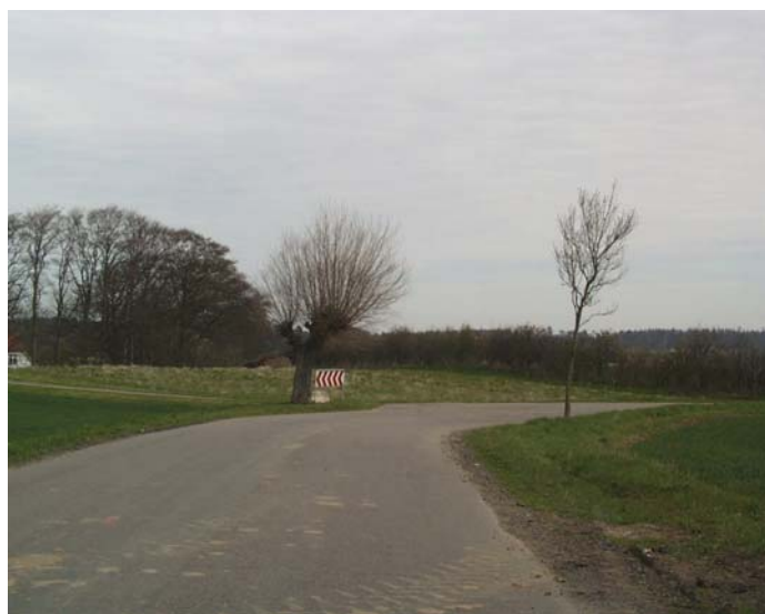
Enkeltstående træ, som kan udgøre en særlig risiko for påkørsel

Trafiksikkerhedsgennemgangen medførte 212 anmærkninger fordelt på 90 strækninger. Der er kommet forslag til virkemidler til forbedring af vejnettet.