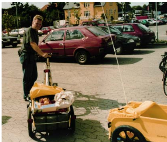
Budcykel fra Præstø

Det særlige cykeludstyr til transport af varer har været en succes. Efter en forsøgsordning, hvor det kun var testpiloter, som afprøvede udstyret, var der flere borgere, som efterfølgende meldte sig frivilligt til at anvende udstyret. Udstyret bestod bl.a. af specielle cykelanhængere.