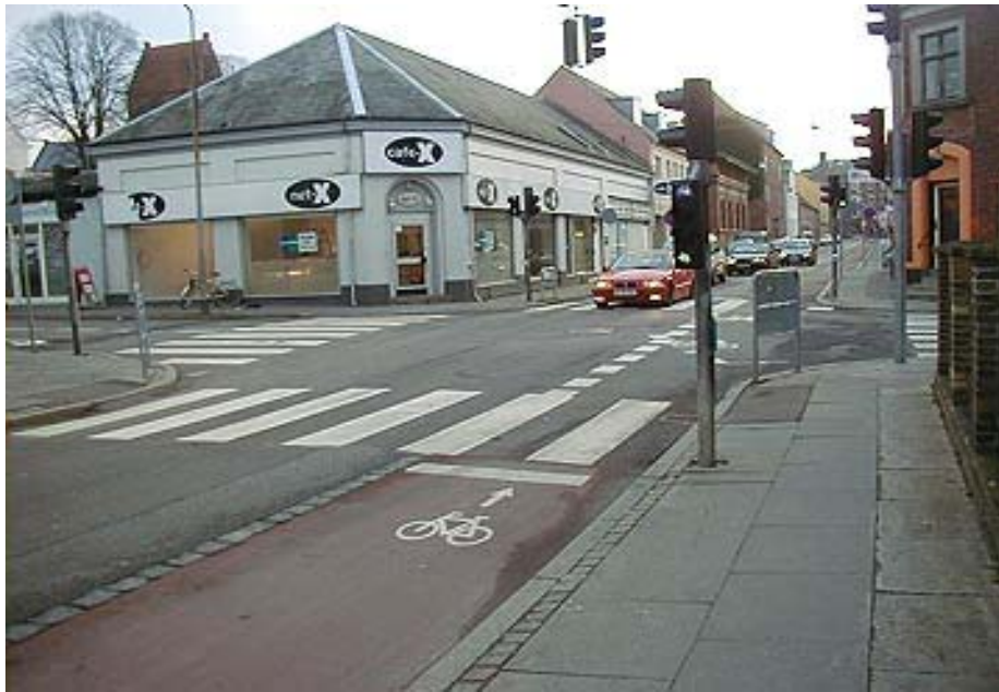
Modstrømscykelsti i Roskilde

Evalueringen peger på, at modstrømscykelruterne har medvirket til at fremme cykeltrafikken i bymidten, hvor cykeltrafikken er steget betydeligt samtidigt med, at biltrafikken er faldet. Endvidere har brugerne udtrykt en tilfredshed med projektet. Der er endnu ikke lavet en egentlig ulykkesevaluering af projektet.