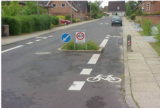
Foranstaltning i Nordbyen i Randers

På baggrund af en trafikmodel og en hastighedsplan blev der etableret en 40 km/t hastighedszone i Nordbyen med anlæg af enkelte og dobbelte indsnævringer, minirundkørsler og vejlukninger. De fleste enkeltsporede indsnævringer blev etableret ved indkørslerne til området. Foranstaltninger blev placeret med længere afstand end anbefalet i Byernes Trafikarealer.