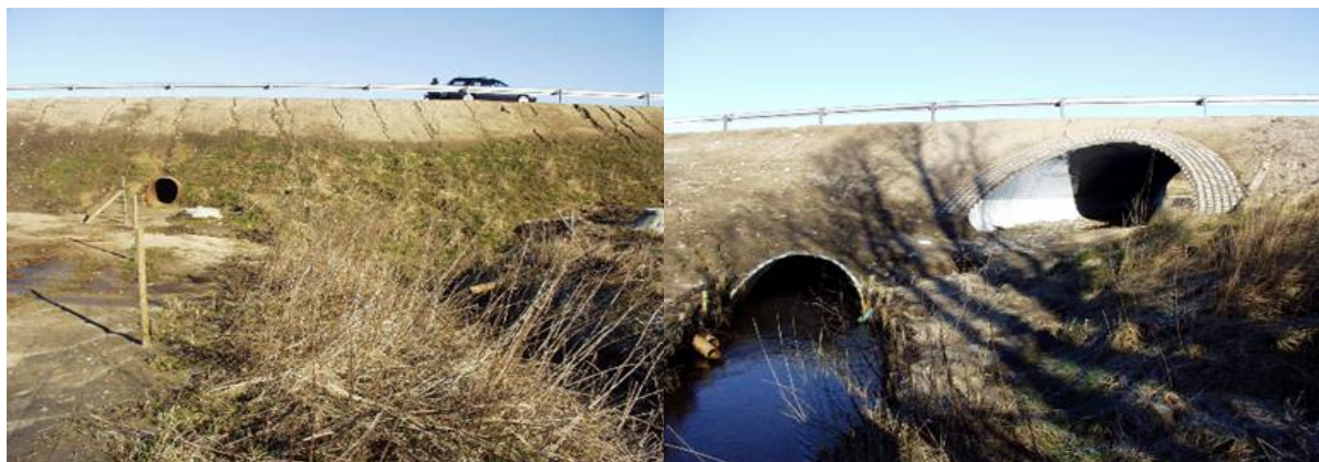
Faunapassager i Nordjyllands Amt

Projektet er gennemført i forbindelse med etablering af cykelsti ved landevejen.