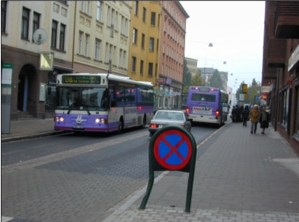
Figur 1. Klackhållplats på Södra Förstadsgatan. Gatans typsektion är 3,0 m gångbana+3,15 m körbana+0,45 m mittremsa+3,15 m körbana+2,0 m parkering+3,0 m gångbana.