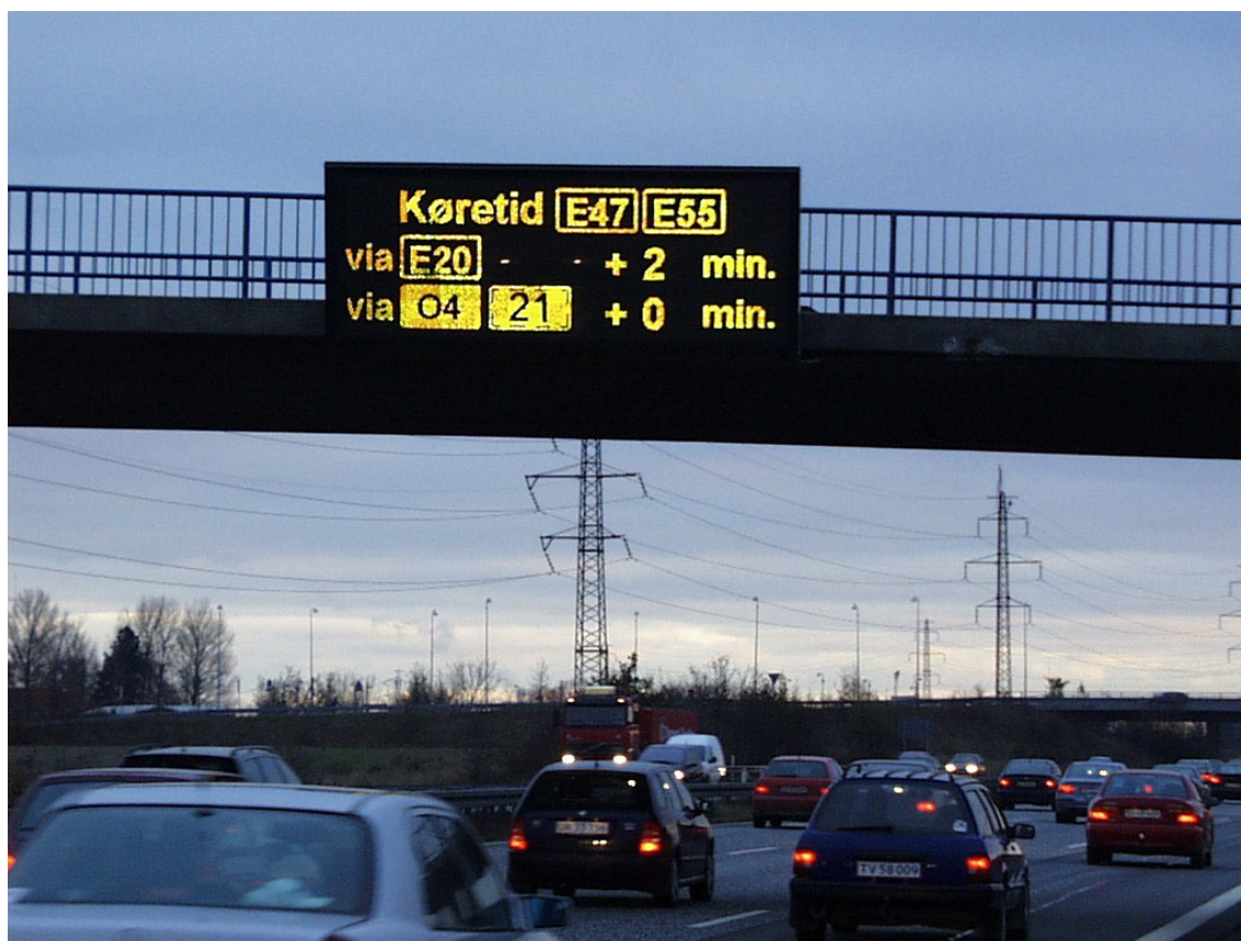
Figur 4: Variabel informationstavle ved Greve, som informerer om forventede forsinkelser

onstavlerne dato og klokkeslæt eller eventuelt andre informationer. Den forbedrede information hjælper trafikanterne med at foretage et fornuftigt valg mellem to ruter, enten via Køge Bugt Motorvejen eller via O4/Holbækmotorvejen.