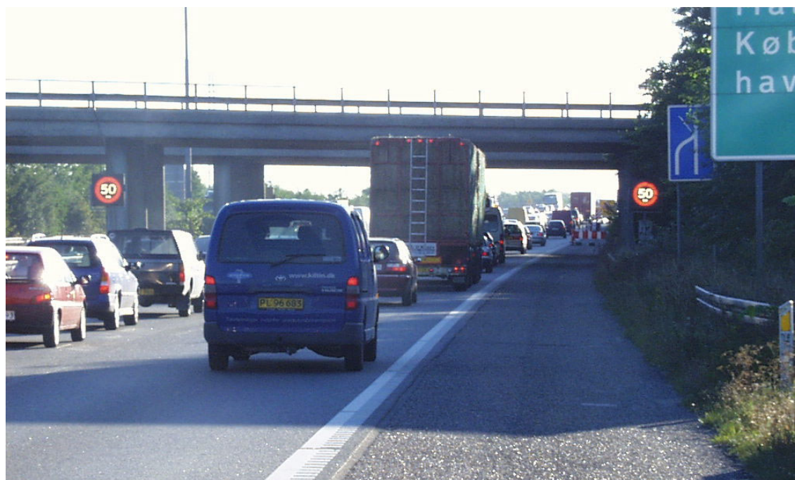
Figur 3: Automatisk hastighedsregulering på Køge Bugt Motorvejen i nordgående retning lige før anlægsområdet

Hastighedstavlerne fungerede således, at der på baggrund af informationer fra detektorspoler (nye spoler og eksisterende TRIM-spoler) kunne registreres kø. Hvis detektorspolerne registrerede lave hastigheder blev der foretaget en trinvis nedsættelse af hastighedsbegrænsningerne via 90, 70, 50 km/h frem mod køens bagende, samt på selve køstrækningen. Når køen forsvandt, blev den etablerede hastighedsbegrænsning automatisk ophævet igen. Anlægget fungerede dynamisk, så udstrækningen af de reducerede hastighedsbegrænsninger løbende blev tilpasset køens udstrækning. Personale i Vejdirektoratets TrafikInformations-Center (T.I.C.) kunne imidlertid altid overstyre hastighedstavlerne uafhængigt af køvarslingen, eksempelvis i forbindelse med uheld eller andre hændelser med indvirkning på trafikafviklingen. Det blev dog altid sikret, at hastighedsbegrænsningen var tilpasset den aktuelle hastighedsbegrænsning i anlægsområdet, som under normale omstændigheder var på 80 km/t. Anlægget blev overvåget og betjent fra Vejdirektoratets T.I.C.