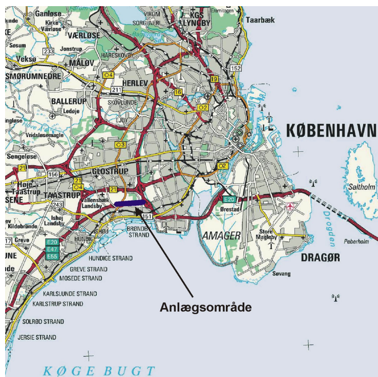
Figur 1: Den 2,8 km lange strækning som er under udvidelse på Køge Bugt Motorvejen

Der blev i januar 2001 indgået en politisk aftale i Folketinget om at udvide Køge Bugt Motorvejen fra 4 til 6 spor på strækningen mellem Motorring 3 og Vallensbæk Torvevej. Anlægsarbejderne blev påbegyndt i slutningen af maj måned 2002, og blev afsluttet ultimo juni 2003.