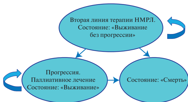
Рисунок 1. Модель Маркова для оценки эффективности второй и третьей линии терапии НМРЛ.

Примечание. НМРЛ – немелкоклеточный рак легкого.