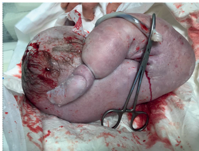
Рисунок 1. Акардиальный плод. Морфологический тип Acardius acephalus .

Существующие клинические рекомендации требуют проведения внутриутробного хирургического вмешательства с целью коррекции СОАП. Вместе с тем такой подход может потенциально