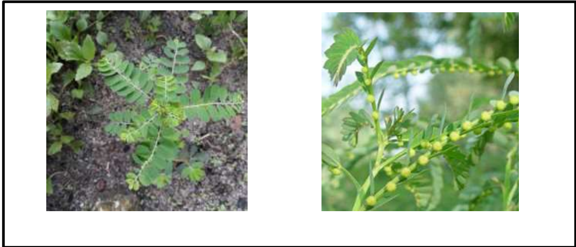
Gambar 1. (a) Tumbuhan Meniran Hijau ( Phyllanthus niruri Linn); (b) Bunga Meniran Hijau di Ketiak Daun

(Kardinan, 2004: 7). 7 Meniran hijau ( Phyllanthus niruri L.) memiliki batang berwarna hijau muda atau hijau tua. Setiap cabang atau rantingnya terdiri dari 8-25 helai daun. Daun berwarna hijau. Ukurannya 0,5-2 x 0,25-0,5 cm. (Kardinan, 2004: 11). 7 Meniran hijau ( Phyllanthus niruri L.) mempunyai bunga jantan dan betina berwarna putih. Bunga jantan keluar dari bawah ketiak daun sedangkan bunga betinanya keluar di atas ketiak daun. (BPPP, 2009: 29). Kepala sari meniran hijau yang sudah matang akan pecah secara membujur. (Kardinan, 2004: 11). 7 Gambar meniran hijau dan bunganya ditunjukkan pada Gambar 1.