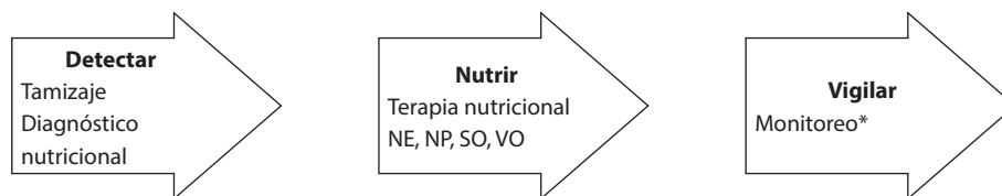
Figura 1. Etapas del cuidado nutricional según el Principio # 2 de la Declaración de Cartagena. NE: nutrición enteral; NP: nutrición parenteral; SO: suplementos orales; VO: vía oral. *Monitoreo y seguimiento del plan nutricional intrahospitalario y plan de egreso hospitalario con manejo nutricional, que incluye la educación nutricional para el paciente, cuidador y familia.

El tamizaje nutricional busca identificar los pacientes desnutridos o en riesgo de desnutrición. Las herramientas de tamizaje validadas permiten identificar los