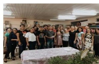
Figura 06 – formação com professores do Ensino Médio.