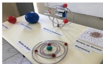
Figura 04 – Evolução Atômica.