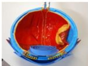
Figura 02 – Globo Ocular