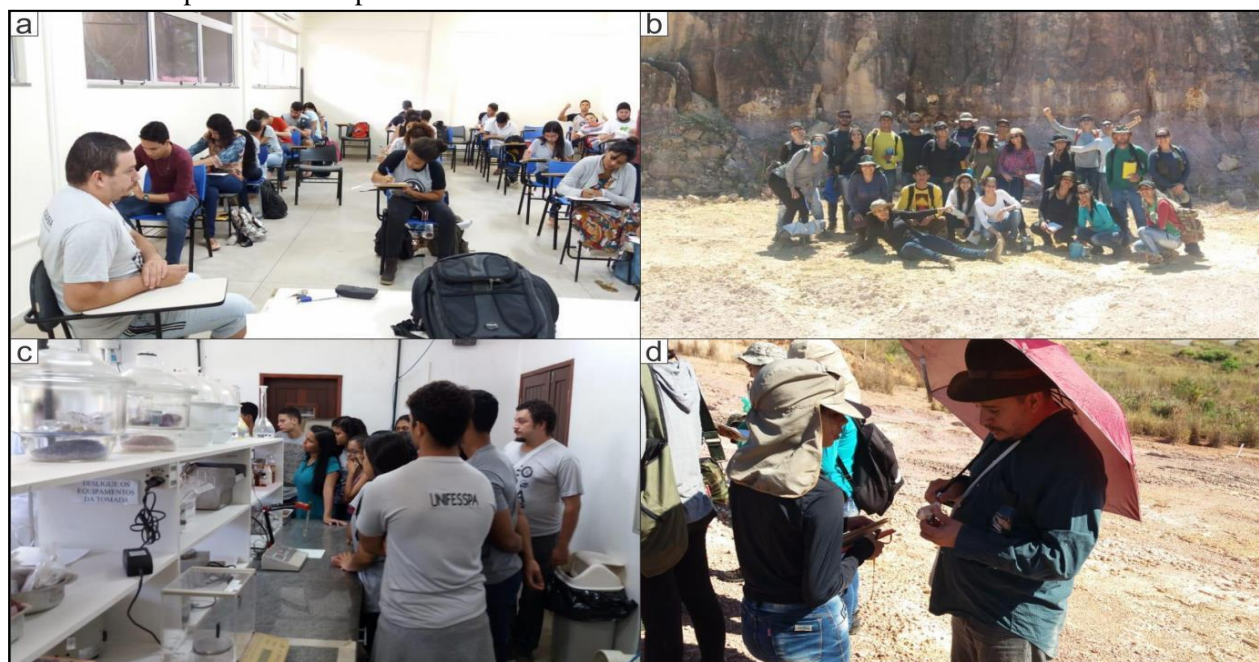
Figura 1: Atividades desenvolvidas durante a Monitoria da disciplina de Sedimentologia. a: Atividade em sala de aula, b: Atividades em prática de campo, c: Atividade em laboratório de Tratamento Minérios, d: Atividades em prática de campo.

Para melhor desempenho, inúmeros materiais foram utilizados com caráter de melhorar o aprendizado. Livros, softwares e Datashow oram principais equipamentos usados nas aulas. Em sala de aula as atividades foram voltadas a auxiliar os alunos por meio de solução de dúvidas e resoluções de listas de exercícios. Nas aulas práticas, o monitor acompanhou os alunos em atividades em laboratório e atividade de campo na cidade de Marabá-PA. Para garantir a integridade física dos alunos todas às regras de segurança foram respeitadas conforme orientação do professor. Em horários alternativos, foram realizadas aulas práticas extras para dar apoio a alunos com maior dificuldade de aprendizado e até aqueles que tinham maior interesse na disciplina.