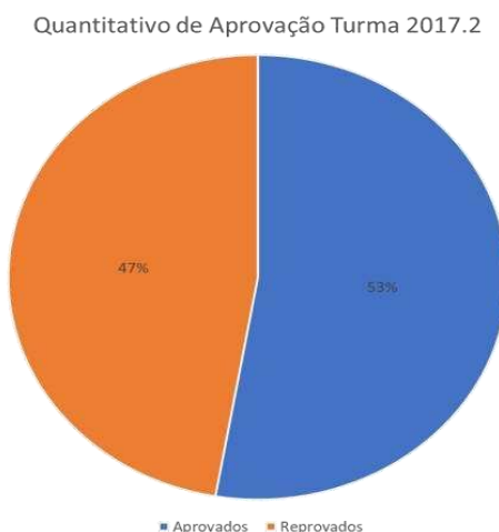
Figura 1 – Quantitativo de Aprovação em Cálculo I (2017.2).

Em termos do índice de evasão (ver Figura 2), obtivemos como resultado: o índice de evasão diminuiu, tal que a Turma teve apenas 24% de evasão, menos de 1/3 da turma abandonou a disciplina e/ou o curso. Notou-se que a evasão neste curso se dá em maior número principalmente nos semestres iniciais, em média do 1º ao 3º semestre, o que denota um resultado bastante satisfatório em se tratando de 1º semestre, no qual os alunos ainda podem vislumbrar a possibilidade de uma escolha errada de curso ou mesmo terem vontade de fazer algum tipo de mobilidade interna ou externa. Além disso, demonstrou que os alunos buscaram a aprovação até o fim da disciplina.