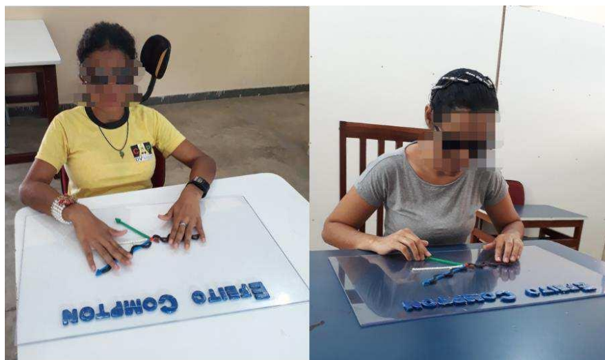
Figure 3. Aula prática com as alunas voluntária.

Na sala de aula, algumas matérias abordadas no Ensino Médio, principalmente as de física moderna, são pouco inclusivas com os estudantes que possuem deficiência visual. Para contornar esta situação, nos dias atuais existem diversos meios de ensino que podem gerar uma aula mais informativa e com interação entre todos os alunos, a utilização de maquetes, gravações de áudio, brinquedos educativos e representações minimizadas do conteúdo lecionado. Esses elementos de aprendizagem mostram bons resultados no ensino (FILGUEIRAS et al. , 2008).