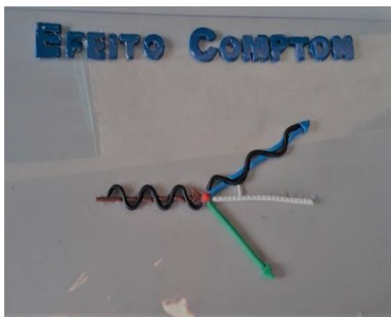
Figura 2. Roteiro do Experimento

O experimento em três dimensões (3D) sobre o Efeito Compton foi feito utilizando os seguintes materiais: quadro de material acrílico transparente que foi usado para fazer base da maquete; massa de biscuit que foi utilizada para modelar o experimento; tintas coloridas de tecidos para pintar a massa de biscuit; e cola de artesanato necessário para fazer a união da massa de biscuit com a base da maquete.