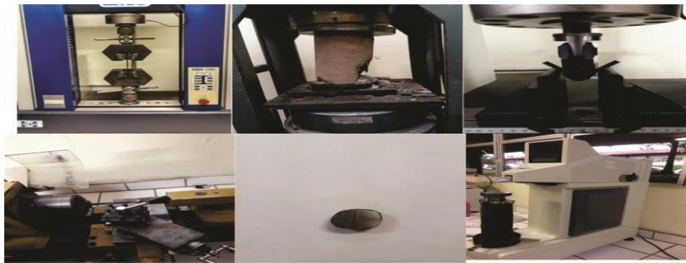
Figura 1 – Ensaio de (a) tração, (b) compressão, (c) flexão e (f) dureza; (d) Preparação de amostra; (e) peça após ensaio de dureza.

Seguindo os roteiros, as aulas práticas foram ministradas de forma sequencial, de acordo com o embasamento da teoria dada em sala de aula. A figura abaixo demonstra alguns ensaios que foram realizados, como: ensaio de tração; ensaio de compressão; ensaio de flexão; ensaio de dureza.