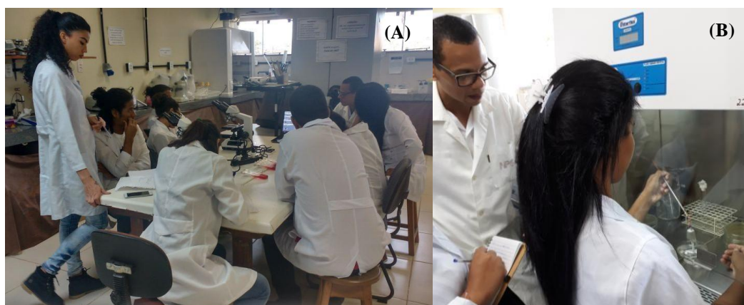
Figura 2. Discentes em aula prática no Laboratório Multiuso de Biologia: Microscopia de lâminas coradas pelo método de Gram (A); Técnica de semeadura no fluxo laminar (B)