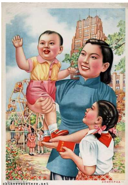
Figura 11: Growing up in happy times, 1953 (Crescendo em tempos felizes)