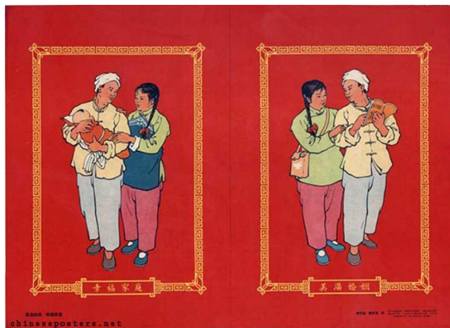
Figura 5: A happy marriage, a happy family, 1955 (Um casamento feliz, uma família feliz)