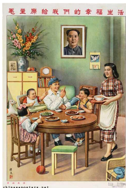
Figura 12: Chairman Mao gives us a happy life, 1954 (Presidente Mao nos dá uma vida feliz)

Fonte: The IISH-Landsberger Collections. Disponível em: https://chinese posters.net/posters/e16-269.php . Acesso: 22 de agosto de 2019.