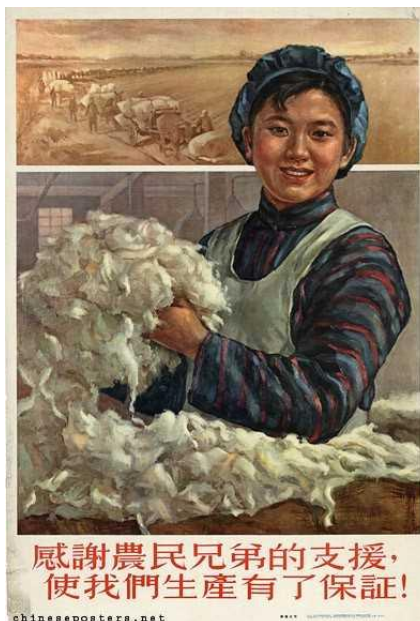
Figura 8: We are grateful for the support of our peasant Brothers for ensuring our production!, 1956 (Somos gratos pelo apoio de nossos irmão camponeses para garantir nossa produção!)

Fonte: The IISH-Landsberger Collections. Disponível em: https://chinese-posters.net/posters/e15-379.php . Acesso em: 22 de agosto de 2019.