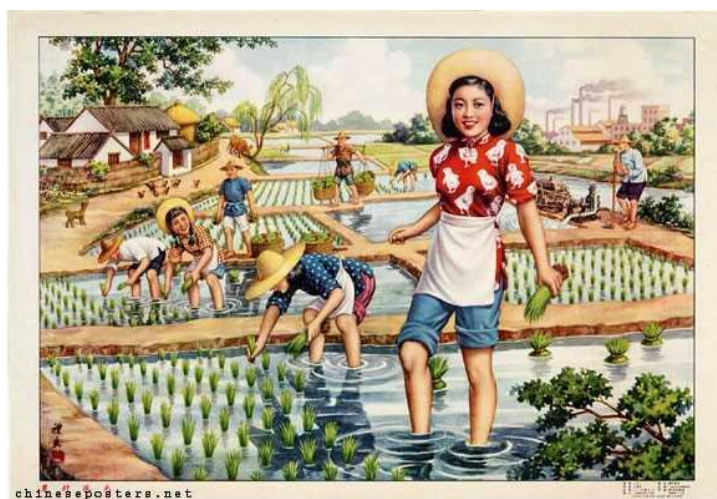
Figura 6: New view in the rural village, 1953 (Nova visão na aldeia rural)