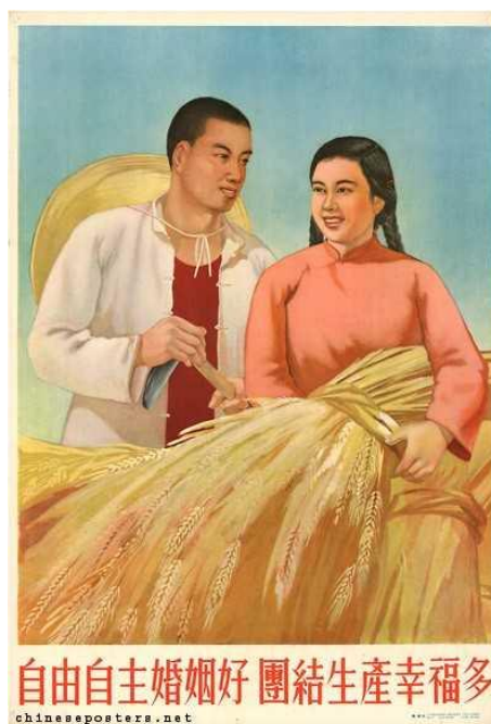
Figura 3: A free and independent marriage is good, there is great happiness in unified production, 1953 (Um casamento livre e independente é bom, há uma grande felicidade na produção unificada)