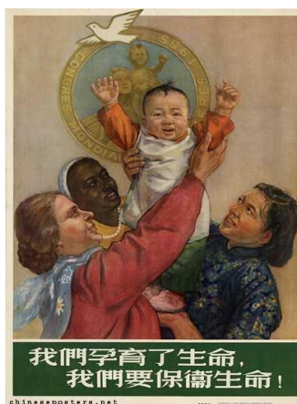
Figura 19: We have been pregnant with life, we want to safeguard life!, 1957 (Nós estivemos grávidas da vida, queremos salvaguardar a vida!)