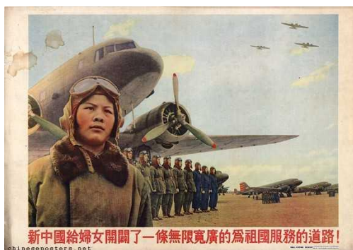
Figura 18: The New China has given women the opportunity of serving the nation boundlessly and liberally! (A Nova China deu às mulheres a oportunidade de servir a nação sem limites e liberalmente!)

Fonte: The IISH-Landsberger Collections. Disponível em: https://chinese posters.net/posters/e15-945.php . Acesso: 22 de agosto de 2019.