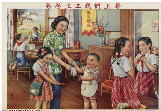
Figura 13: Daddy goes to work, we go to school, 1954 (Papai vai para o trabalho, nós vamos para a escola)

Fonte: The IISH-Landsberger Collections. Disponível em: https://chinese posters.net/posters/pc-1954-005.php . Acesso: 22 de agosto de 2019.