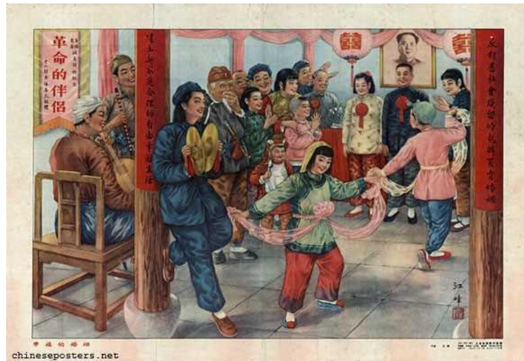
Figura 1: A happy marriage, 1953 (Um casamento feliz 7 )