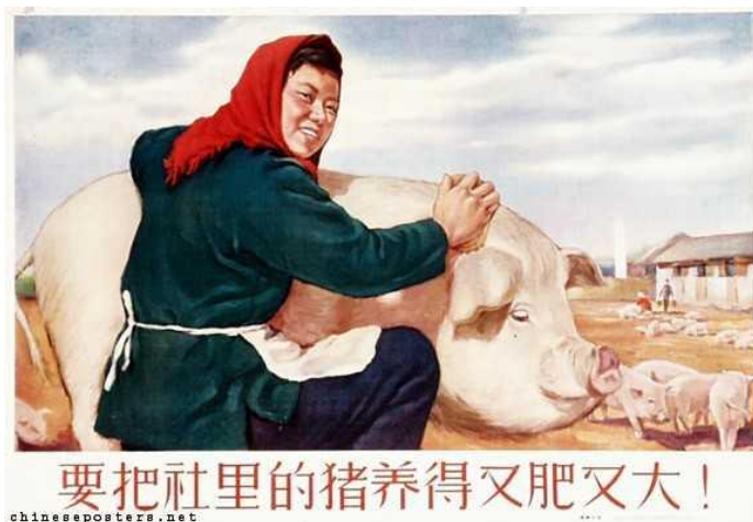
Figura 7: The hogs of the commune must be raised to be fat and big!, 1956 (Os porcos da comuna devem ser criados para serem gordos e grandes!)