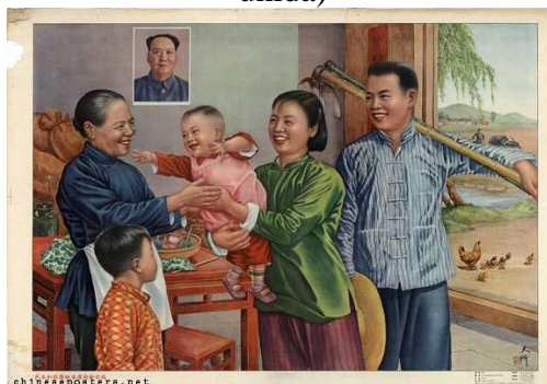
Figura 14: A new household that is democratic, peaceful, and engages in united production, 1954 (Um novo lar que é democrático, pacífico e se engaja na produção unida)

Fonte: The IISH-Landsberger Collections. Disponível em: https://chinese posters.net/posters/e15-286.php . Acesso: 22 de agosto de 2019.