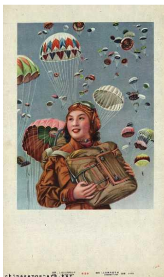
Figura 17: Parachuters, early 1950s (Paraquedistas, início dos anos 1950)