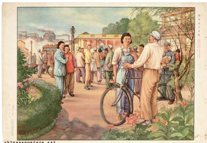
Figura 9: Her achievement of glory, 1954 (Sua conquista da glória)