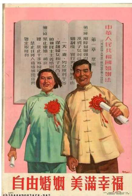
Figura 2: Freedom of marriage, happiness and good luck, 1953 (Liberdade de casamento, felicidade e boa sorte)