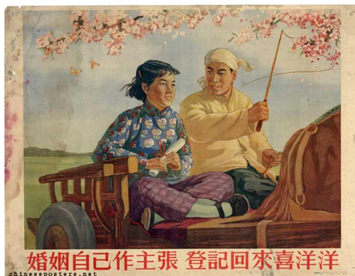
Figura 4: In marriage, keep an eye on your own interests, and return radiant after registration, 1953 (No casamento, fique de olho em seus próprios interesses e volte radiante após o registro)