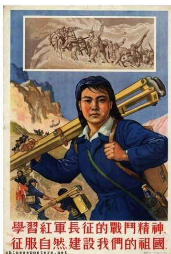
Figura 15: Study the battle spirit of the Red Army during the Long March, conquer nature, build up our nation, 1953 (Estude o espírito de batalha do Exército Vermelho durante a Longa Marcha, conquiste a natureza, construa a nação)