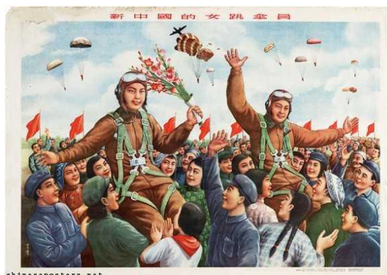
Figura 16: New China’s female parachuters, 1955 (Paraquedistas do sexo feminino da nova China)