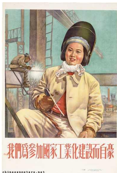
Figura 10: We are proud to participate in the industrialization of the nation, 1954 (Estamos orgulhosos de participar da industrialização da nação)