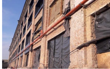
Рис. 1. Вигляд конструкцій перемичок та простінків що підлягають розбиранню

1. Спочатку виконати комплекс заходів задля забезпечення на об'єкті безпечних умов праці, що включало облаштування ділянки виконання робіт електроосвітленням, засобами пожежогасіння, покажчиками, що застерігають про небезпечні зони і вказують місця проходів робітників і ін., відключення, огорожування або перенесення діючих і не діючих інженерних комунікацій, що потрапляють в зону виконання робіт, інше [5].