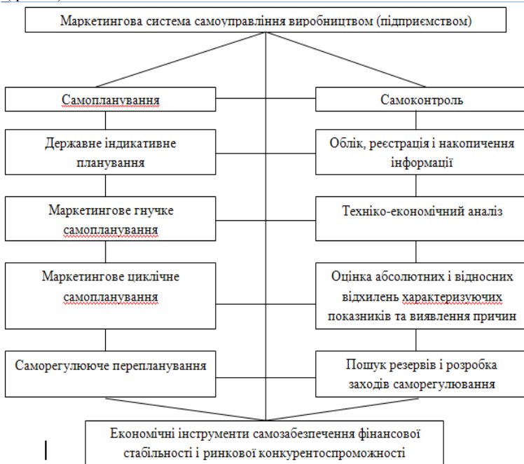
Рис. 2. Схема маркетингової системи самоуправління виробництвом (підприємством)

Виходячи із важливої потреби економічних досліджень, розробок і розрахунків, необхідно передбачати в штатних розкладах лінійних інженерно-технічних працівників і адміністративно-управлінського персоналу відповідну чисельність менеджерів-економістів, здатних якісно і своєчасно забезпечити економічну стабільність і конкурентоспроможність на ринку. Разом з тим, обумовлюється потреба повного перезавантаження системи управління виробництвом і повною виробничо-господарською діяльністю. Сучасну маркетингову систему самоуправління виробництвом можна запропонувати в наступному схематичному вигляді ( рис. 2).