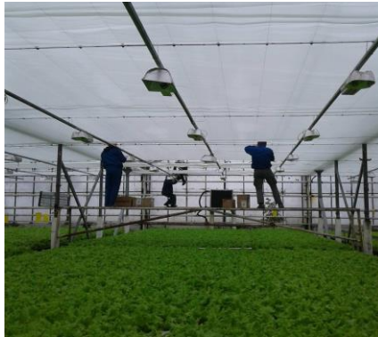
Рис.4. Монтаж системи горизонтального зашторювання

Відповідно до ТК монтаж системи зашторювання виконується ланкою з 4 чоловік з використанням СПП, на якому також розміщуються ящики з комплектуючими системи та інструментом (рис.4).