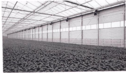
Рис.3. Вертикальна система зашторювання

Екраном (шторою) розсувних систем зашторювання є полімерна тканина типу «HARMONY» «SHS, «HS», «BLACK THERM» шведської фірми «SVENSSON» з різними теплофізичними властивостями. В залежності від матеріалу з якого виготовлена, штора буває теплоізолюючою (теплозберігаючою) або світловідбиваючою (затіняючою), а також універсальною з різним співвідношенням теплоізоляційних та світлопропускних характеристик.[2]