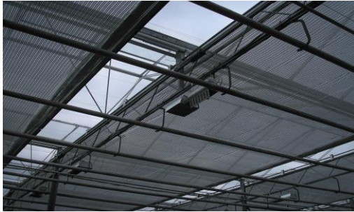
Рис.1. Горизонтальна трособлокова система зашторювання

Трособлокова СГЗ представляє собою систему блоків та привідних валів з барабанами, мотор-редуктора, сталевих нержавіючих тросів та алюмінієвих балок (рис.1).