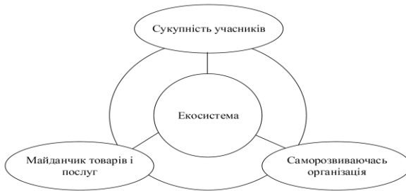
Рис.1. Сутнісні характеристики поняття «екосистеми»

В економічній літературі інноваційні системи, які цілеспрямовано створювалися в епоху лінійних інновацій в масштабах національних або регіональних економік, в останні десятиліття стали тяжіти до сучасного, екосистемного підходу, з його динамічними мережевими взаємодіями.