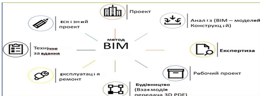
Рис. 1. Життєвий цикл інвестиційно-будівельних проектів

В загальному вигляді, за BIM – методом, життєвий цикл проекту відображає взаємодію учасників інвестиційно-будівельного проекту (рис.1):