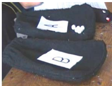
Figura 2. Bolsas de tela oscura y canicas para la cuantificación de probabilidades

La actividad se tomó de la obra de Piaget e Inhelder (1951) respecto al desarrollo de la idea de azar en el niño. El objetivo fue introducir la idea de probabilidad. Se utilizaron dos bolsas no transparentes, etiquetadas “A” y “B”, de las cuales se mostró la composición de sus contenidos de canicas de dos colores (véase la Figura 2).