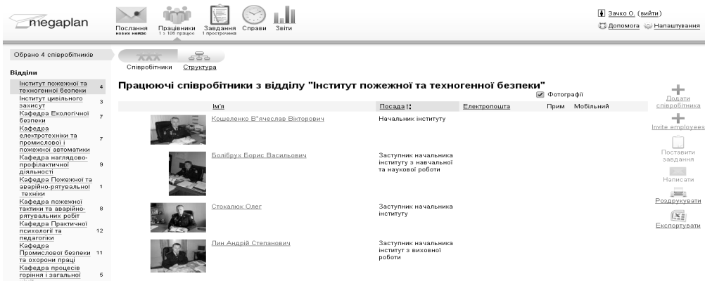
Рис. 2. Робоче вікно структурного підрозділу в системі «Мегаплан»

За допомогою системи була створена модель організаційної структури Львівського державного університету безпеки життєдіяльності (далі ЛДУ БЖД) [3]. На рис. 2 зображено фрагмент структури керівного складу Інститут пожежної та техногенної безпеки ЛДУ БЖД.