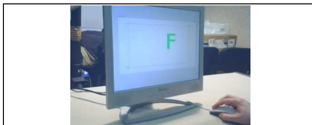
Figure 3 : Une lettre 3D, en coupe 2D, de face depuis la GUI.

Le premier exercice consistait à réaliser une série de six coupes à des coordonnées précises, et le deuxième à reconnaître, à l'aide de coupes 2D, une forme géométrique 3D (une lettre de l'alphabet, voir Figure 3 ) cachée dans un cube constituant un bloc opaque.