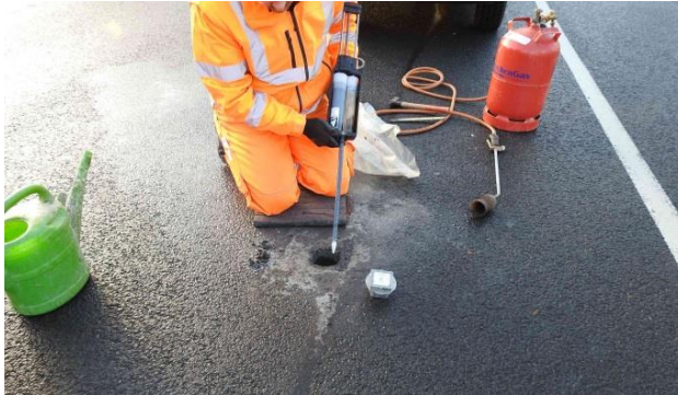
Abb. 2: Einbau eines WIMAG-Sensors vor Ort