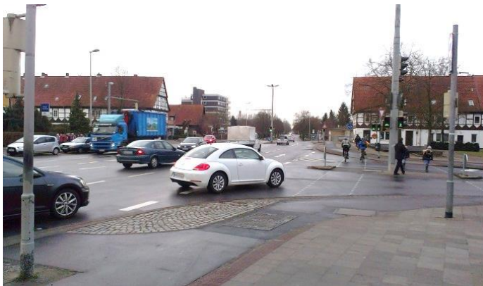
Abb. 1: Tostmannplatz in Braunschweig

Beim verlustzeitbasierten Steuerungsverfahren [1] wird die Steuerungslogik des Verfahrens direkt auf dem vorhandenen Steuergerät umgesetzt.