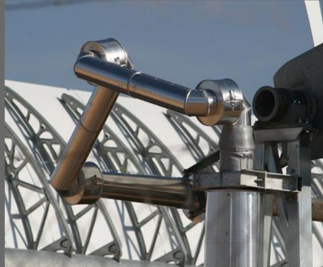
Abb. 2: Ball Joint Baugruppe mit Isolierung