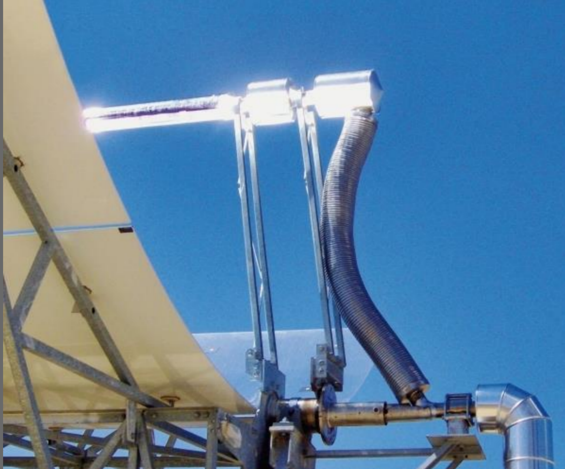
Abb. 1: Flexibler Ringwellschlauch (isoliert) mit Drehdurchführung (hier nicht isoliert)