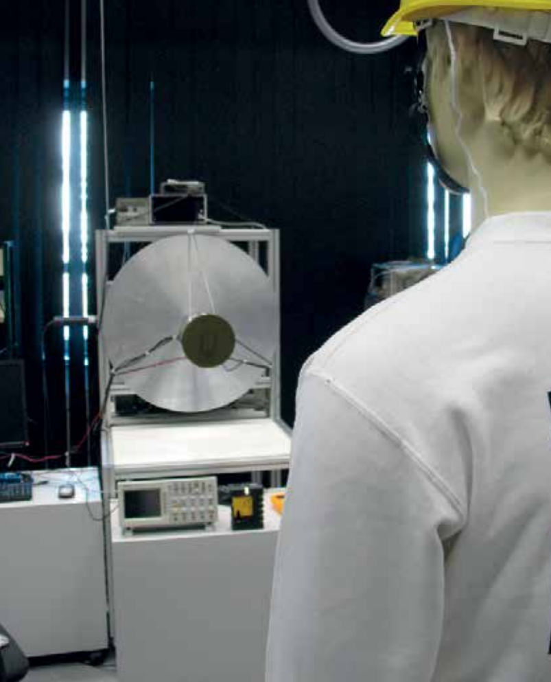
Abb. 3: THz-Körperscanner am DLR

gungen. Die gesammelten Radardaten von Satelliten und Bodenstationen sowie die aufgezeichneten in-situ-Daten wurden in Folge analysiert und auf typische Grenzüberwachungs-Szenarien überführt.