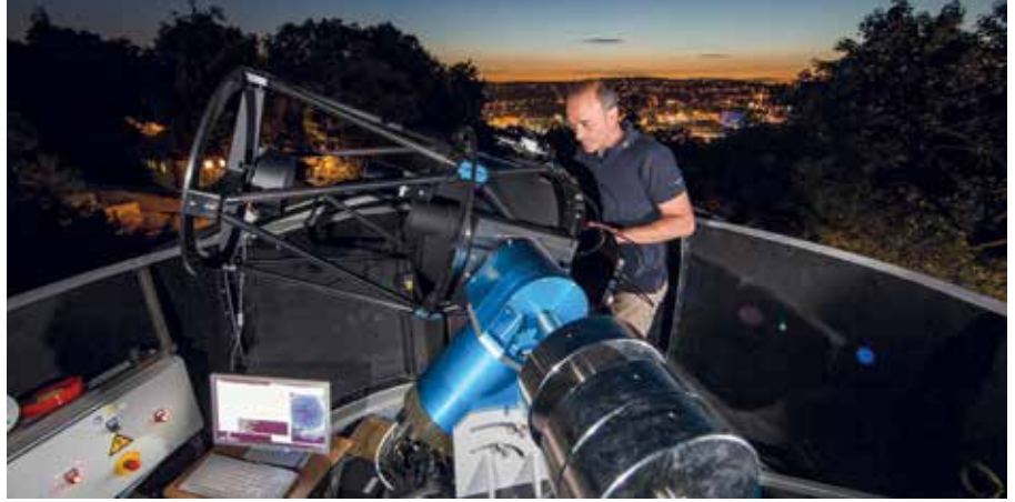
Abb. 5: Entwicklung eines lasergestützten, optischen Beobachtungsverfahrens für Weltraummüll am DLR-Forschungsobservatorium Stuttgart-Uhlandshöhe

wurde, so ist weiterhin intensive Forschung notwendig, um auch kleinste Teilchen vom Boden aus präzise lokalisieren zu können. Dennoch wurde eine langfristige Vision formuliert: In Zukunft könnte ein Hochleistungs-Puls-Laser Weltraummüll-Teilchen abbremmen und zum Verglühen in die Erdatmosphäre wiedereintreten lassen, um die Anzahl von missionskritischen Objekten schrittweise zu reduzieren.