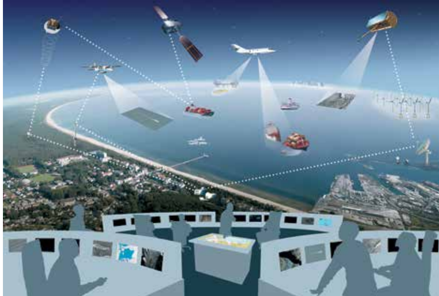
Abb. 1: Maritimes Lagebild der Zukunft

Sicherheitsprobleme zu erarbeiten. Aufgrund der Querschnittlichkeit des Themas wird schnell deutlich, dass tragfähige Sicherheitslösungen immer im Diskurs zwischen Wissenschaft, Wirtschaft, Gesellschaft und Politik erarbeitet werden müssen. Während anfangs eine rein technische Herangehensweise vorherrschte, bei der technologieorientierte Lösungen ohne Berücksichtigung möglicher Implikationen für den Einzelnen entwickelt wurden, hat sich mittlerweile ein szenarienorientierter Ansatz durchgesetzt, der von Bedrohungs- und Gefährdungsszenarien ausgeht, die möglichst allumfassend betrachtet werden. Dieser Ansatz wurde und wird auch im ressortübergreifenden nationalen Sicherheitsforschungsprogramm „Forschung für die zivile Sicherheit“, [2] und [3], verfolgt. Experten sind sich aber mittlerweile einig, dass eine getrennte Betrachtung der Themen Angriffssicherheit (engl. Security) und Betriebssicherheit (engl. Safety) durch einen systemischen Ansatz überwunden werden sollte [4], da oftmals Angriffe auf zu schützende Systeme, wie beispielsweise Kritische Infrastrukturen, an deren betrieblichen Schwachstellen verübt werden. Insbesondere das Themennetzwerk Sicherheit der Deutschen Akademie der Technikwissenschaften (acatech) befasst sich intensiv mit dieser Thematik [5].