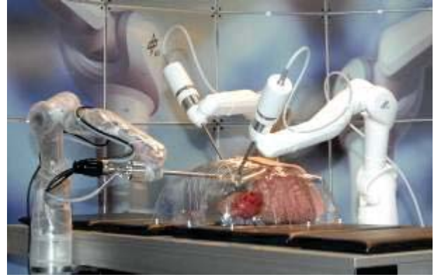
Abb. 1: DLR Telepräsenzscenario für MIRC „MIRO-Surge“. Bild links: im Vordergrund die Eingabestation für den Chirurgen, im Hintergrund das patientenseitige Chirurgierobotersystem. Bild rechts: Chirurgierobotersystem im Detail mit Endoskopführung und zwei Roboterarmen für bimanuelle Telemanipulation.