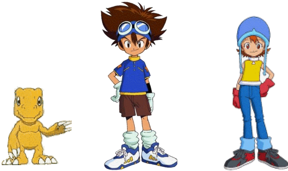
Fra venstre: Agumon, Tai og Sora