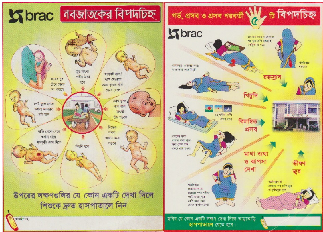
Illustrasjon 3. Informasjonsmateriell fra BRAC