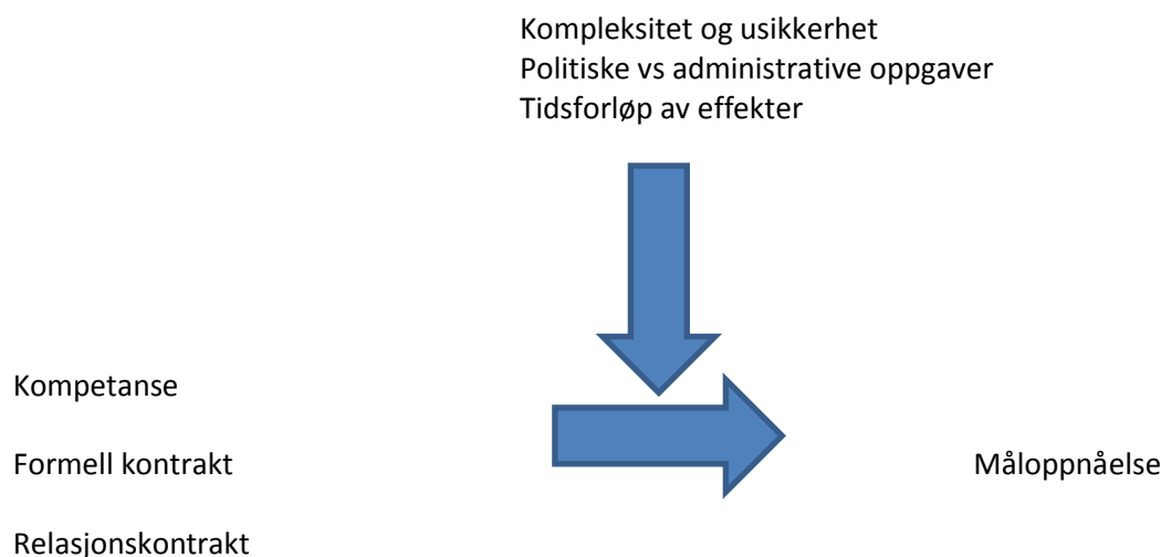
Figur 3.2 Oppfølging og måloppnåelse

I 3.4 har vi gått inn på ulike faktorer som er viktige for å forstå effektivitet i gjennomføringsfasen, og som har innflytelse på om konsulentytelsen bidrar til å håndtere den oppgaven som er beskrevet i kontrakten. I figur 3.1 oppsummeres drøftingen i en modell. Det skilles mellom to tre grupper av faktorer. Egenskaper ved virksomhetens kompetanse, formell kontrakt og innslaget av relasjonskontrakter er faktorer som påvirker ytelsen, og som (riktignok i varierende grad)