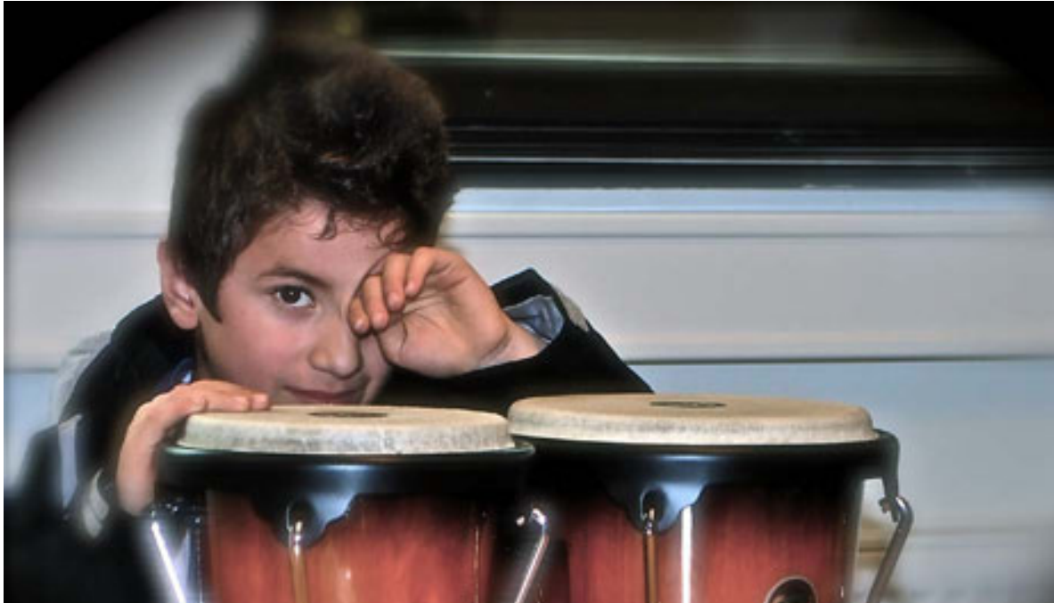
Fra Barnetimen på Saupstad bibliotek.