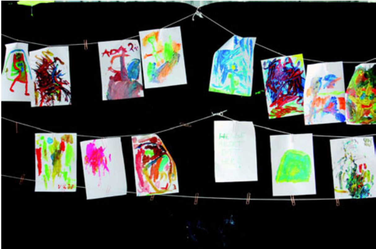
Fra Barnetimen under Pstereo-piknik.