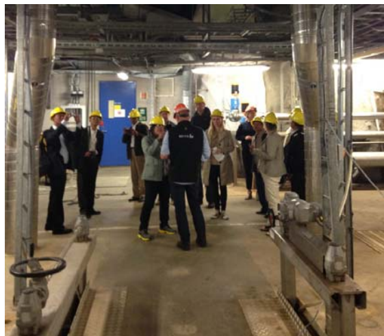
Figur 1. Omvisning på Bekkelaget Renseanlegg, IWRM-kurs i Oslo, september 2014

Del II i kurset i Vannressursforvaltning ble arrangert i Oslo 8. – 12. september 2014. Et detaljert program med beskrivelse av kurset er vist i vedlegg B sammen med en liste over deltakere. Inkludert i kurset var bl.a. en omvisning på Bekkelaget Renseanlegg i Oslo, og et bilde herfra er vist i Figur 1 .