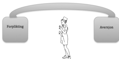
Figur 1. Figuren syner korleis pleiarane står i eit spenningsfelt mellom det å kjenne seg forplikta til å hjelpe bebuarane, samstundes som dei kjenner på ein aversjon.

I dette spenningsfeltet står pleiarane gjerne dagleg, og trass i dei vanskelege kjenslene, kjenner pleiarane på eit stort ansvar for å gje uhilda pleie til alle bebuarane. For pleiarane er lik behandling ein føresetnad, slik andre òg har vist (Jacobsen, 2004). Pleiarane evnar difor å meistre dette ubehaget, ved å stå i det, og utføre arbeidet med å hjelpe alle bebuarar, trass i ubehageleg åtferd. Dei berre gjer det. Det innlærte tankemønsteret for reint og ureint vert slik sett ein viktig del av deira felles pleiehabitus.