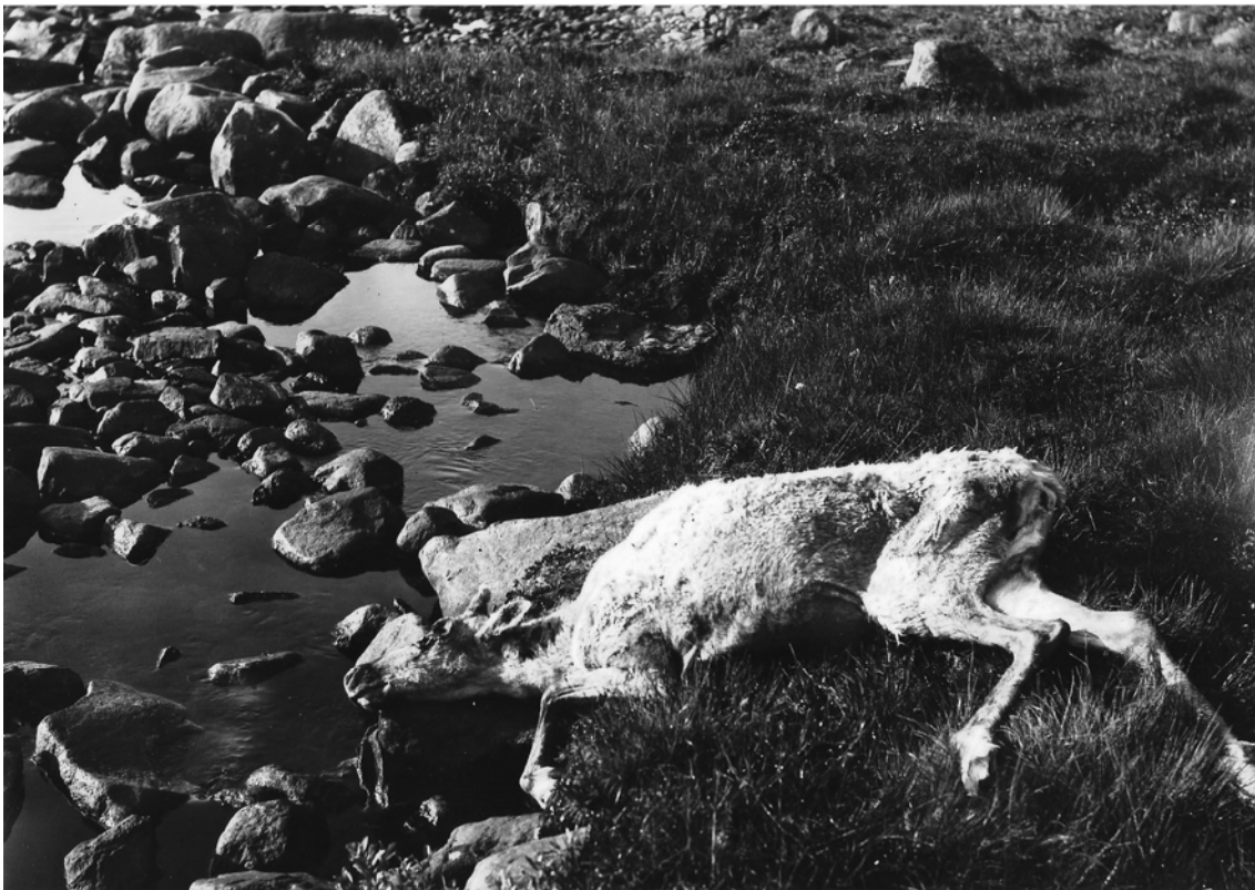
(4) «Viddens Saga» (1914).