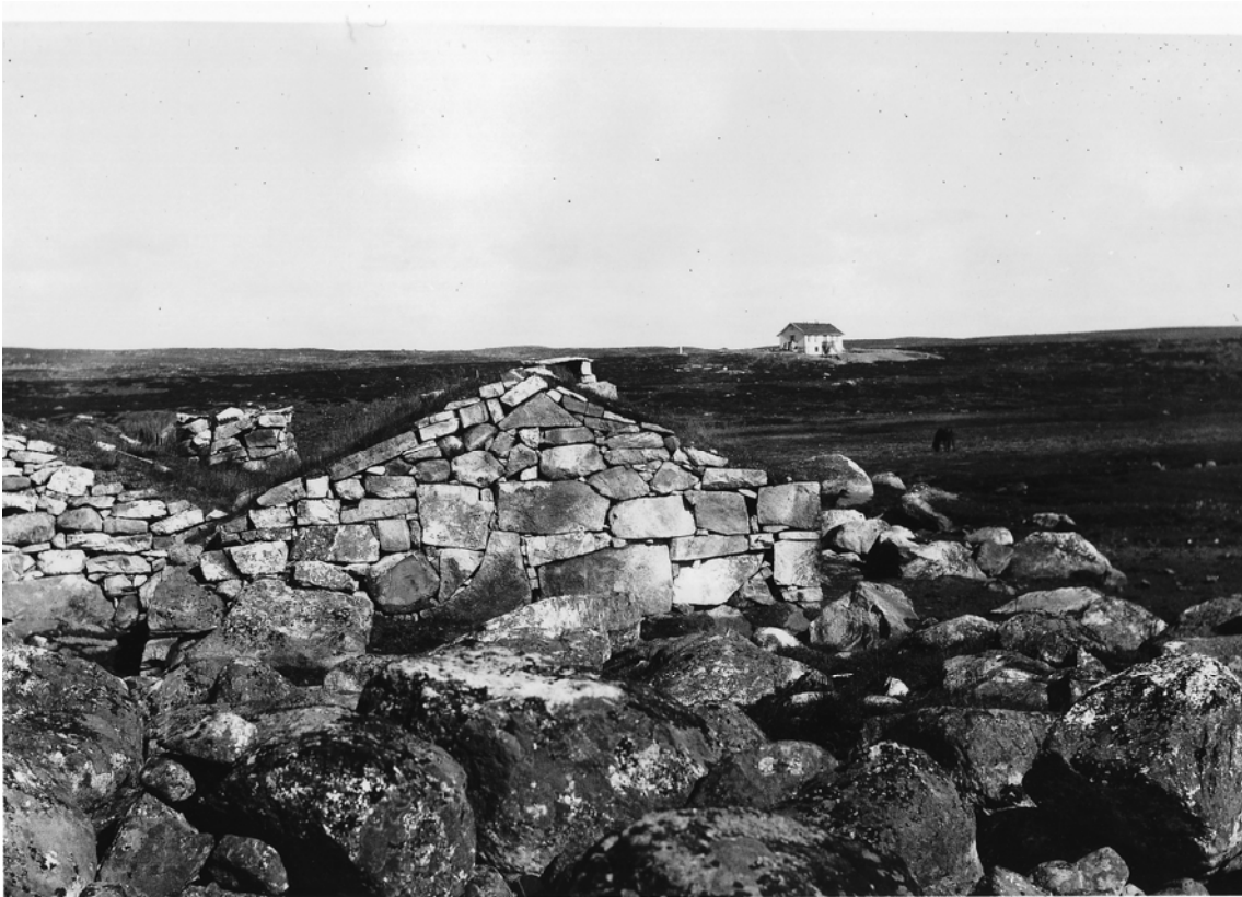
(3) «Bjoreidalshytten gamle og nye» (1914).