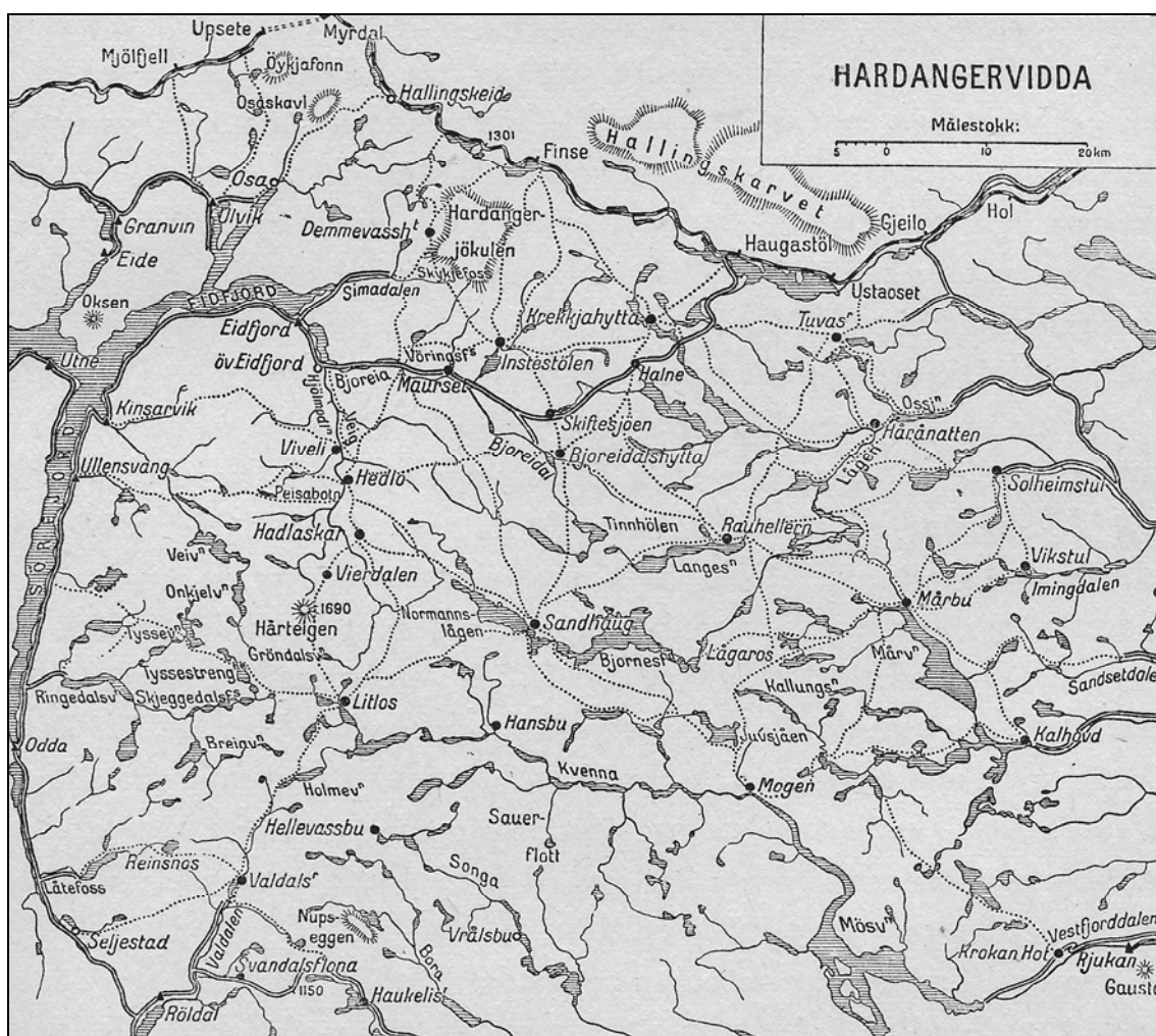
(2) Kart over Hardangervidda. Tegning: Berg.