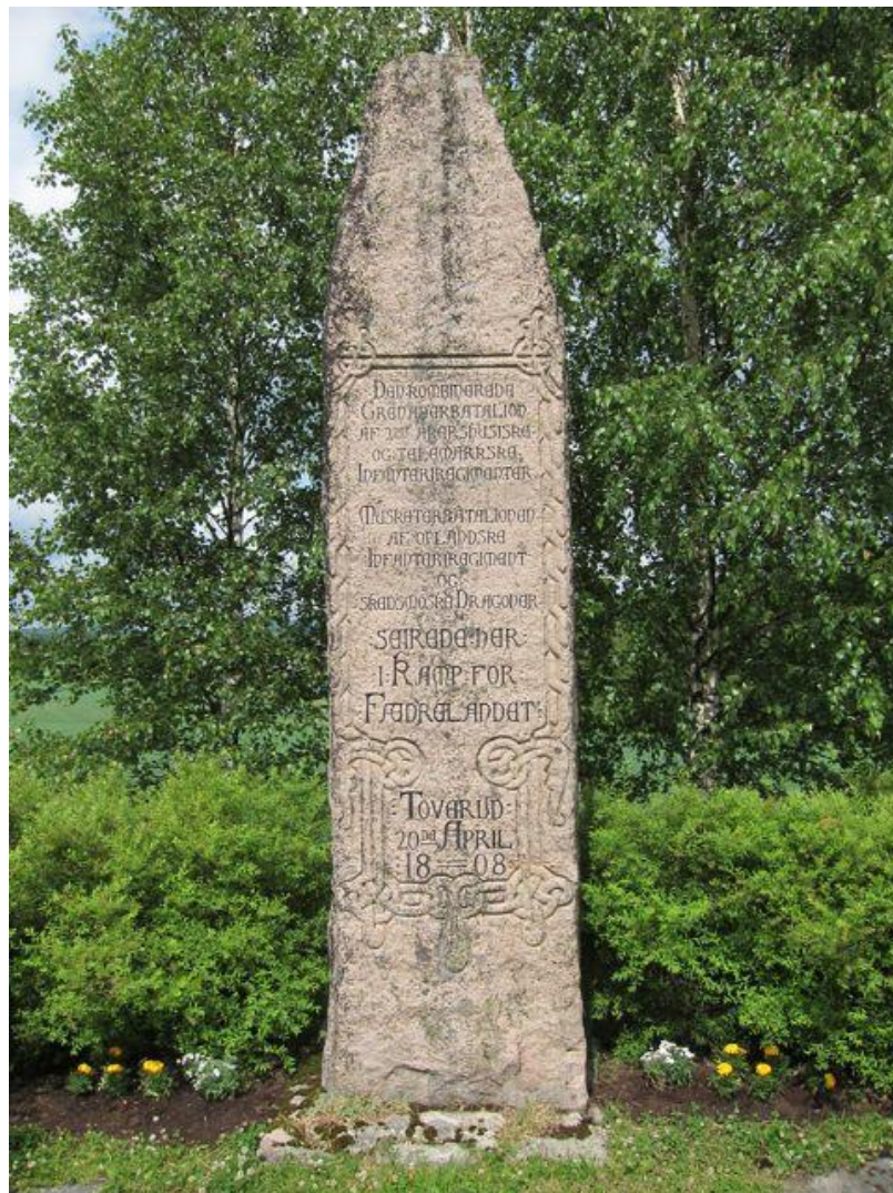
Toverudbautaen i Aurskog-Høland

Masteroppgave i historie Institutt for arkeologi, konservering og historie (IAKH) Universitetet i Oslo Vår 2011