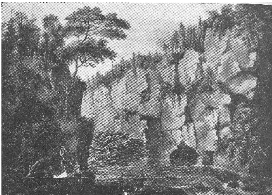
Vrangfos ved Ulefos