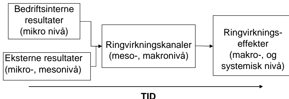
Figur 5.1: Sammenheng mellom resultater, kanaler og ringvirkningseffekter

Som nevnt i kapittel 2 er eksterne og bedriftsinterne resultater fra innovasjonsaktiviteten transformert gjennom et system av økonomiske og kunnskapsmessige interaksjoner (kanaler) til ringvirkningseffekter. Vi kan måle disse effektene med vanlige økonomiske størrelser (se kapittel 4), eller vi kan identifisere dem som strukturendringer i økonomien og teknologien.