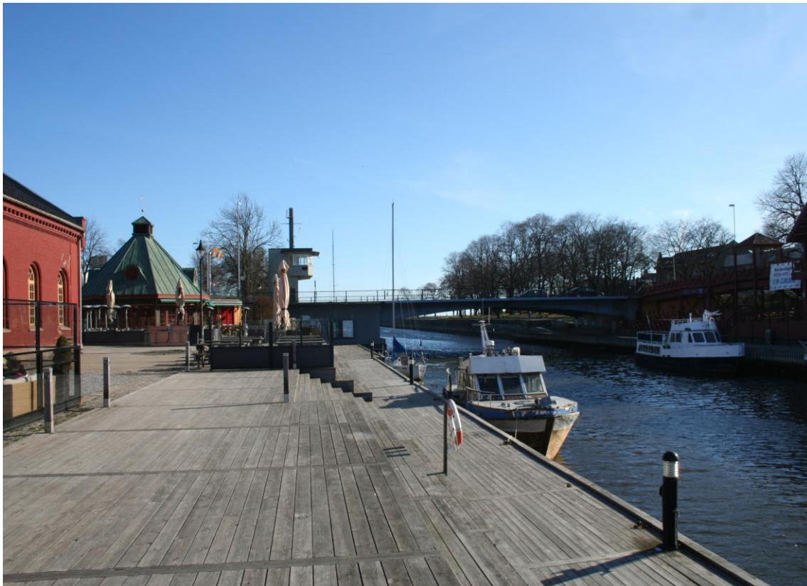
Figur 6: Kanalen. Peppes Pizza i det røde bygget (Tollboden) til venstre.