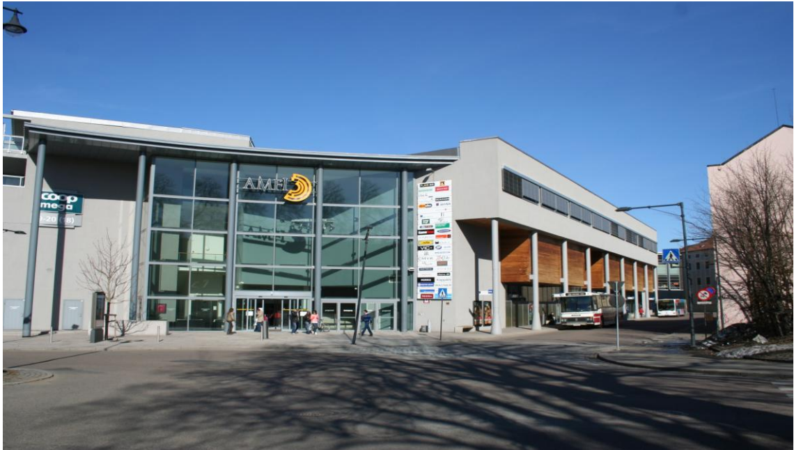
Figur 4: Amfisenterets hovedinngang i sør. Bussgata til høyre.

Gågata har fått mye oppmerksomhet i arbeidet med sentrumsfornyelsen, og ble gjenåpnet sommeren 2009. Kunst og skulpturer har vært fokuset, og denne estetikken er en del av sentrumsplanen som tar sikte på å få folk tilbake til sentrum, vekk fra konkurrerende handlesentre utenfor bykjernen, som Mosseporten Kjøpesenter og Rygge Storsenter.