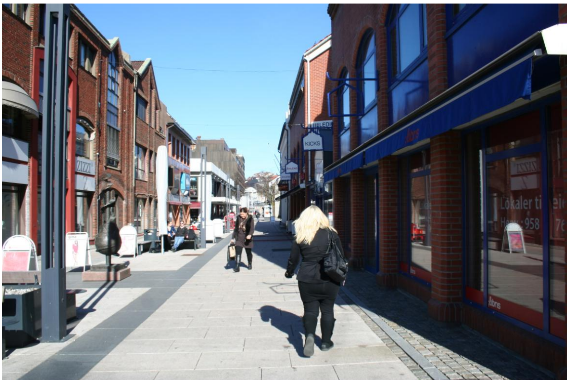
Figur 5: Bilde av gågata, fotografert mot nord.

Mange av informantene opplever altså at gågata og sentrum generelt er blitt folketom. For disse informantene er et levende Amfisenter synonymt med en død gågate. Oppbyggingen av Amfisenteret har derfor i stor grad endret stedsbruken blant informantene, med konsekvenser for bruken av gågata og andre sentrumsområder. Hvordan man ser på denne brukerovergangen er det dog ulike oppfatninger om, som vi skal se i neste delkapittel.