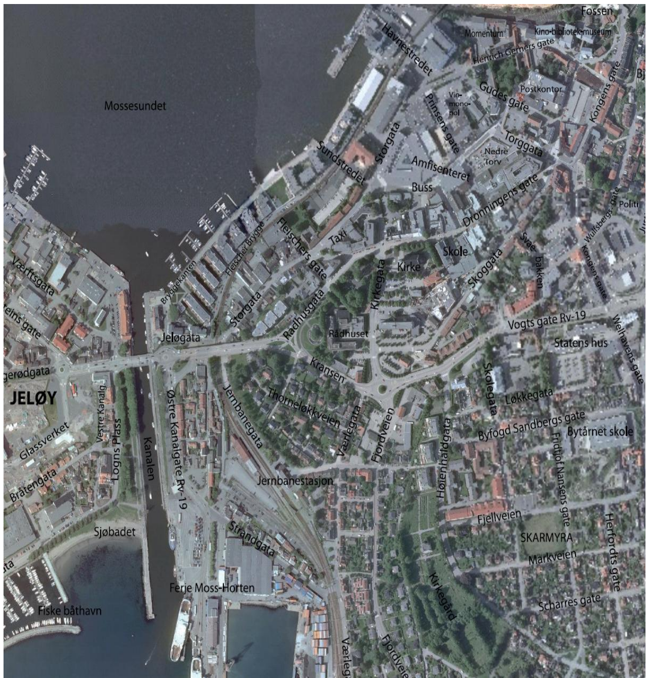
Figur 2: Oversiktsbilde over Moss sentrum. Merkinger: Møllebyen ligger helt nord på Kartet. Området er merket "Fossen", "Kino-bibliotek-museum", og "Momentum". Kanalområdet er på kartet merket fra "Sundstredet" i nord til "Sjøbadet" i sør. Gågaten er på bildet markert som "Dronningensgate" og ligger som en nord-sør (vest) akse.

Dugnadsansvaret er fordelt mellom kommunen, investorer og utbyggere. Prosjektene i sentrumsoffensiven er mange, men kollektivtrafikk, kunst i sentrum, samt estetikk i planleggingen har fått fokus (Moss Kommune 2007). Styrket busstilbud har vært ett tiltak for å få flere folk til sentrum. Kunst i sentrum har videre vært et viktig prosjekt,