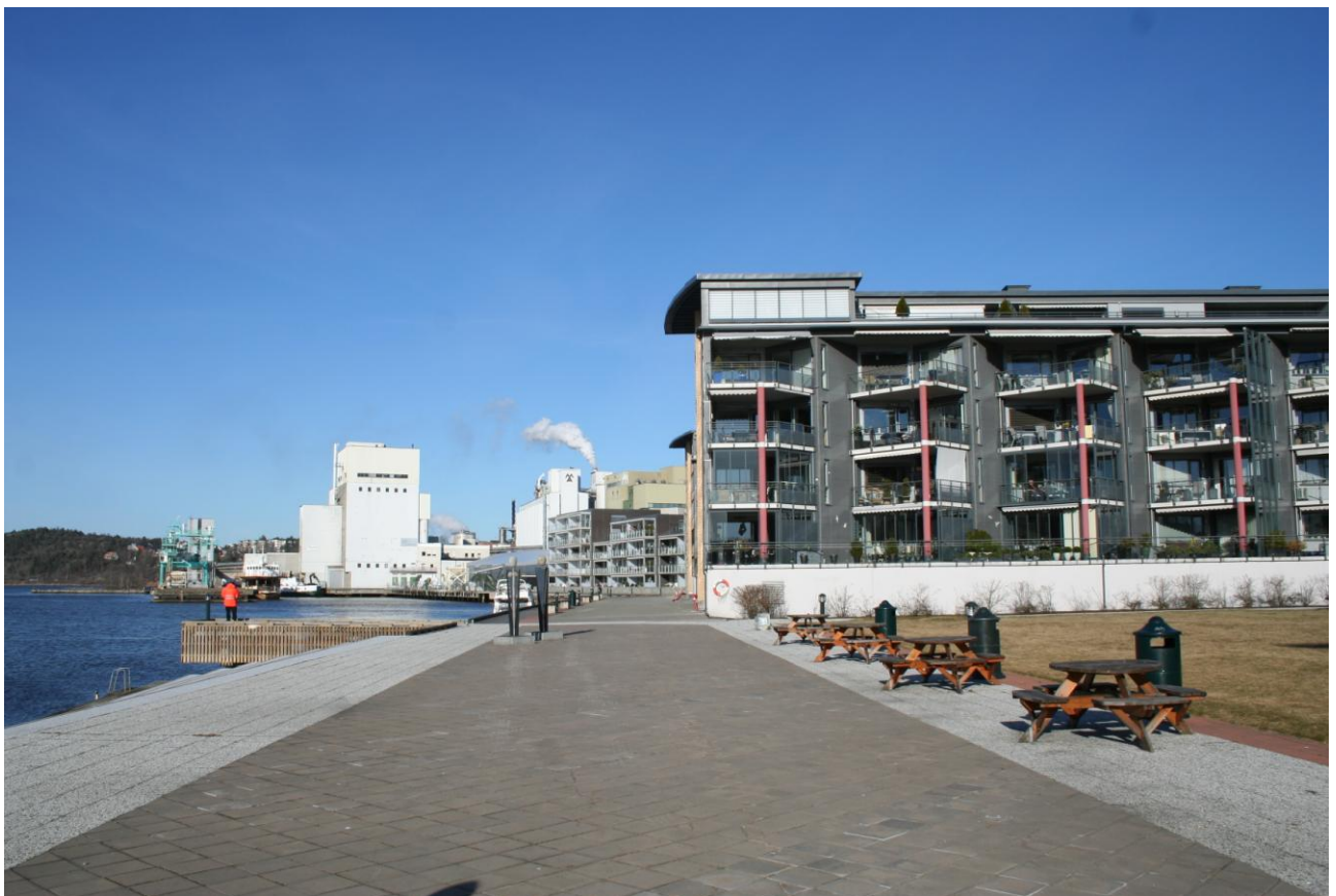
Figur 7: Promenaden utenfor de private boligsameiene Fleischer Brygge, mot Sundstrede Brygge.