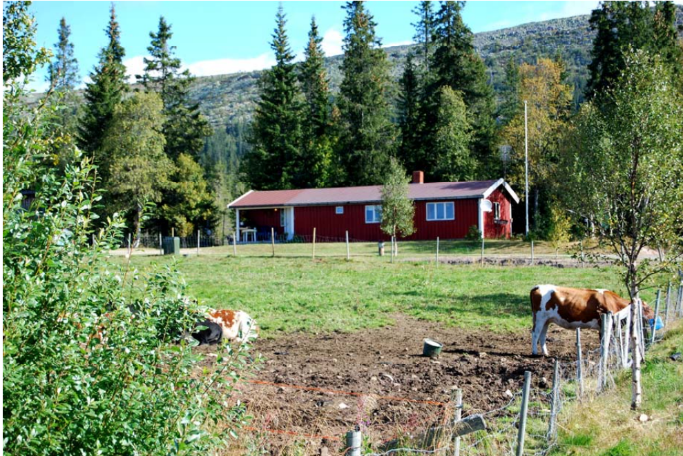
"Flendalen fellesbeite"