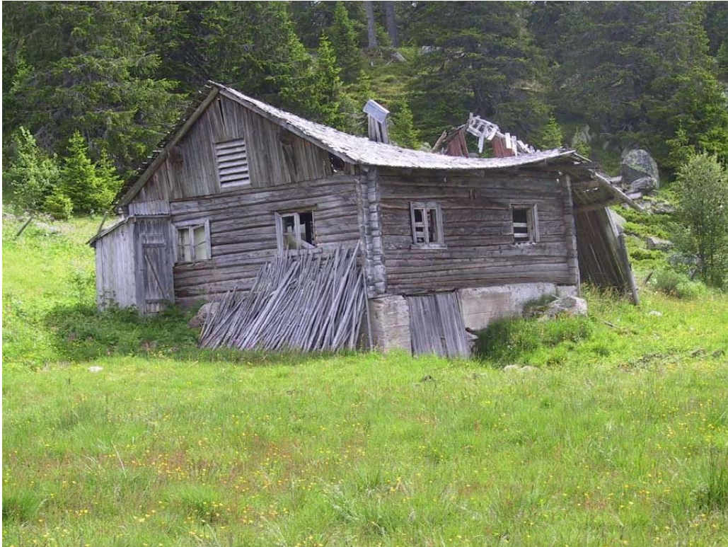
"Falleferdig bygning"