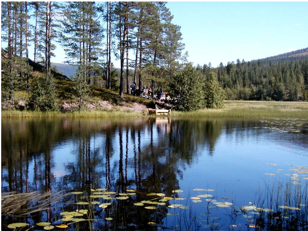
"Naturperle i Østre Trysil"

Turen gir ikke bare moralske føringer på hvordan å møte naturen, men som det ble påpekt ovenfor også moralske holdninger ovenfor naturen. Proctor (1998) sier at landskap alltid er moralsk. Han sier at beskrivelser av landskap alltid har normativ karakter. Han sier: "Like biophysical landscape, which are shaped by and response to tremendous geological, climatic and other forces, moral landscape are result of (and particular moment in) a process of creating and interpreting meaning" (Proctor 1998: 194). Det romantiske landskapsblikket rommer holdninger forenlig med å verne landskapet mot moderne installasjoner og utforming. En hytteeier påpekte: "Så innvanderes bygda av store firehjulstrekkere og store hytter. Jeg har en følelse av det ikke er riktig". Det landskapet som skal vernes er det opprinnelig eller det autentiske. Turen framproduserer et landskapsideal om det opprinnelige og det autentiske. Dette bilde kan, som kulturlandskapet, omtales som et ideal. Atskillelsen av natur og samfunn fremdyrker ideal om den autentiske og rene natur. Hytteeierne søker ekte naturopplevelser. "Når vi kommer opp dit så faller vi inn i en rytme som er veldig god. Og som er den samme fra gang til gang" (hytteeier).