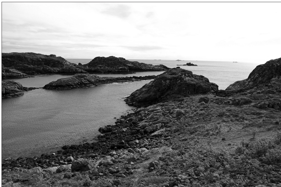
Figur 3. Innseilinga til den østre havna i Storvågan (Rekøykeila).

over denne valen ved at bygningsrester og annet avfall ble fylt ut i fjæra (T-7434: 910±90, AD 1020–1220; T-7436: 880±40, AD 1050–1220; T-7433: 820±90, AD 1130–1270; T-7438: 720±60, AD 1260–1290; T-7437: 770±70, AD 1220–1280). Etter denne tid var det tettbebygde havneområdet sammenhengende med ei nord-sør-gående gate og havnebasseng i øst og vest. Det er altså tiden før denne utvidelsen av bebygd areal som er tema her. I all hovedsak er det et utgravningsfelt i sørdelen av området som da har interesse.