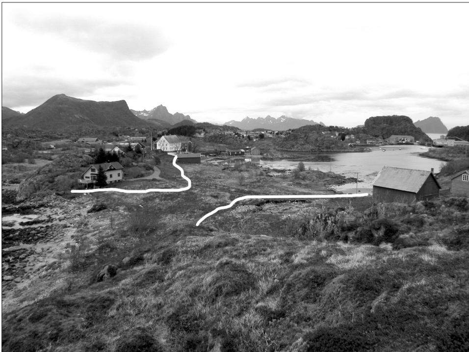
Figur 1. Kulturlagsområdet og havnene i Storvågan. Strandlinje før ca. AD 1200 er markert.