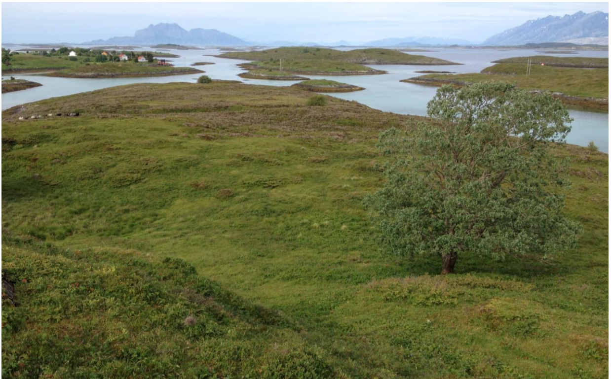
Bilde 4: Deler av øya har naturbeitemarkspreg med gras- og urtedominans. Et og annet tre vokser på øya.