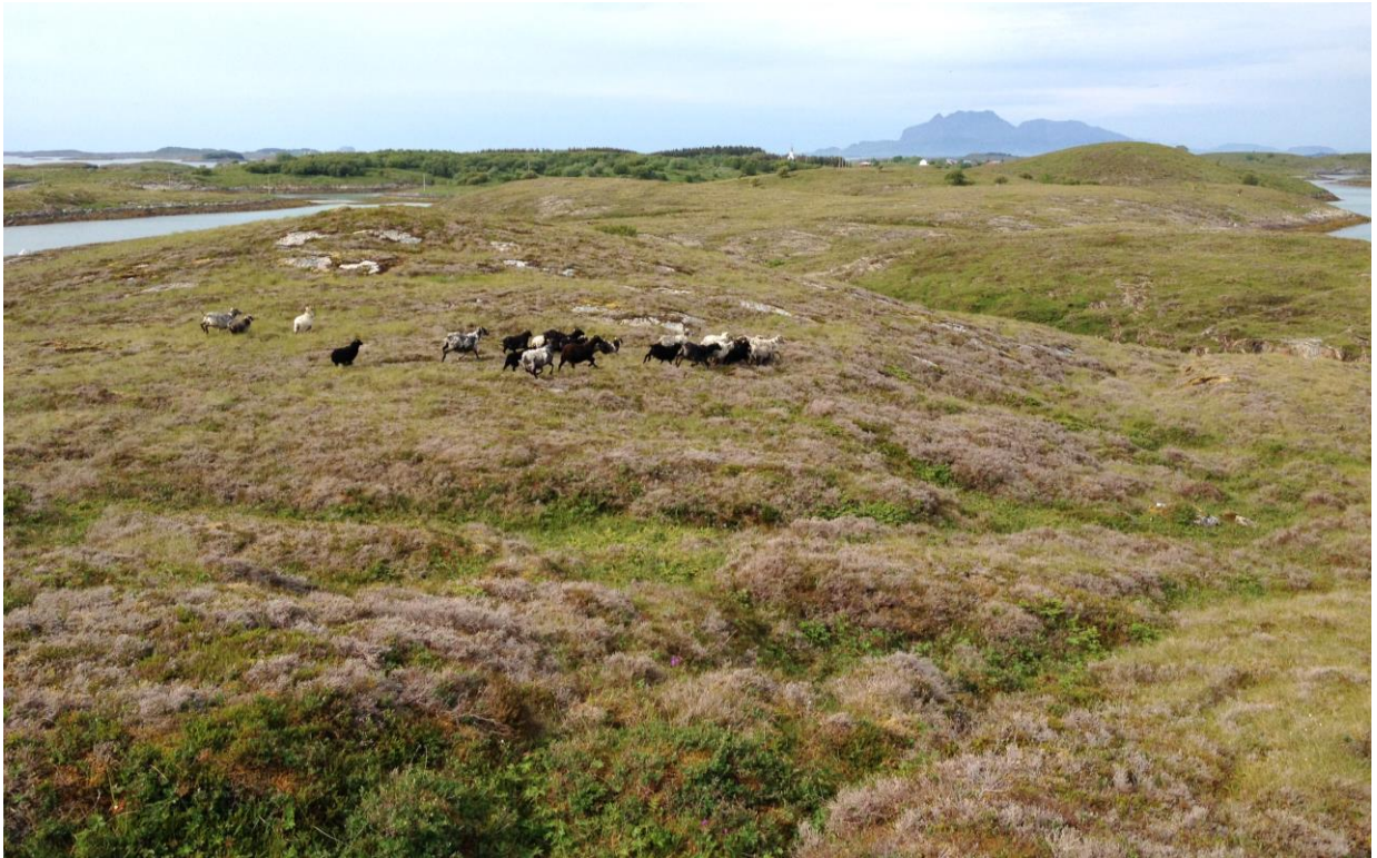
Bilde 3: Ni søyer med 13 lam av GNS beitet på Buøya i beitesesongen 2015.