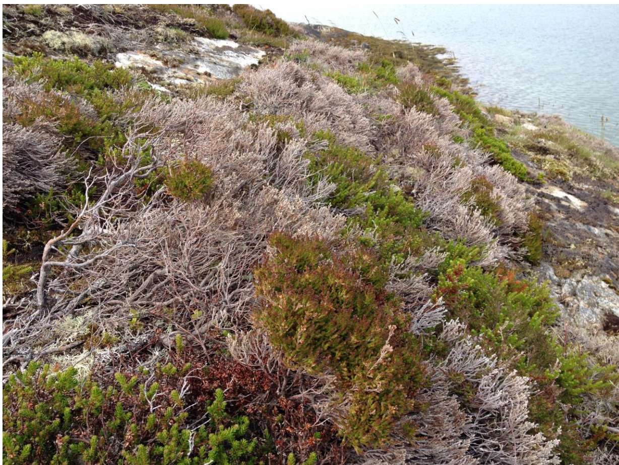
Bilde 1: Død og frisk røsslyng side om side. Til tross for den ekstreme tørkevinteren i 2013/2014 har noe røsslyng klart å spire fra det som tilsynelatende ser ut som døde kvister.