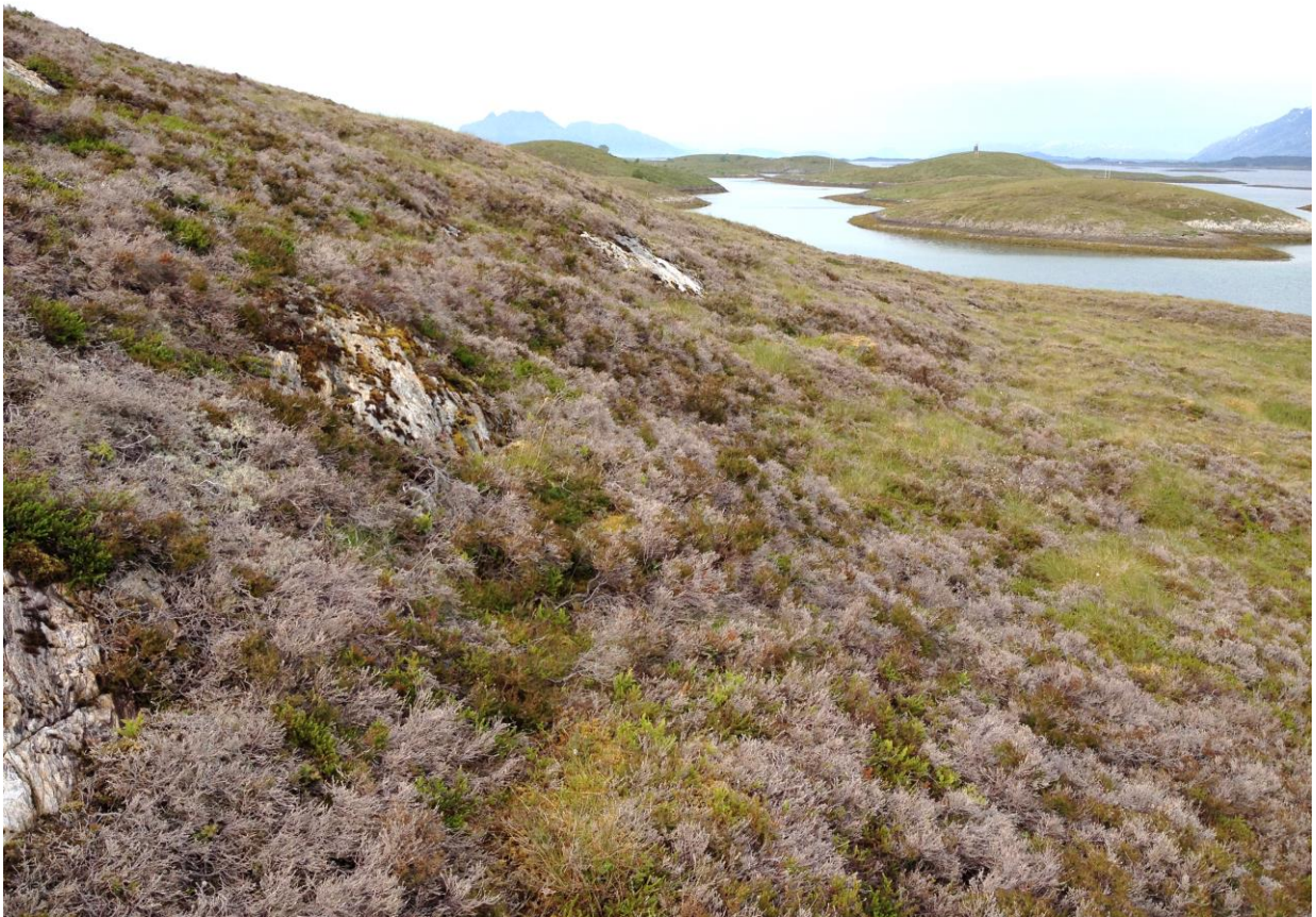
Bilde 2: Den sørlige delen av Buøya har stor andel av død røsslyng og bør brennes for å bedre beitegrunnet. Det er viktig at sviflatene ikke blir for store. Svi av 10-15 dekar om gangen.